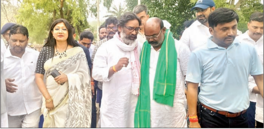
पूर्व सीएम हेमंत सोरेन अपने पैतृक आवास नेमरा पहुंचे और अपने चाचा के श्राद्ध कर्म में शामिल हुए। इस दौरान वे परिवार के लोगों से मिलकर भावुक हो गये। उन्होंने मीडिया से दूरी भी बनायी रखी। श्राद्ध कर्म में शामिल होने के बाद वापस लौट गये।