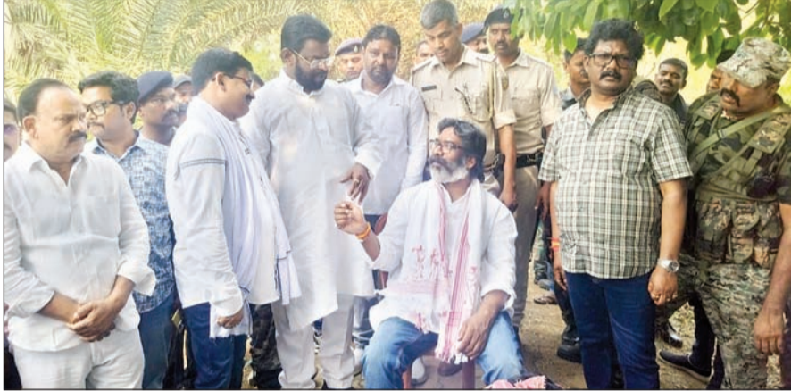
हेमंत सोरेन अपने पैतृक आवास नेमरा पहुंचे और अपने चाचा के श्राद्ध कर्म में शामिल हुए। इस दौरान वे परिवार के लोगों से मिलकर भावुक हो गये। उन्होंने मीडिया से दूरी भी बनायी रखी। श्राद्ध कर्म में शामिल होने के बाद वापस लौट गये।