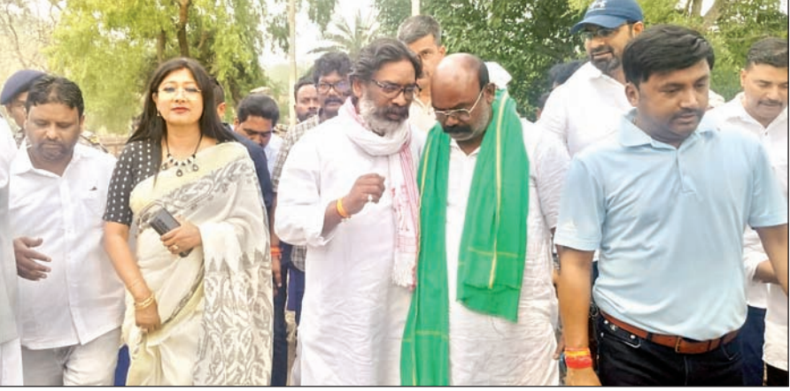
पूर्व सीएम हेमंत सोरेन अपने पैतृक आवास नेमरा पहुंचे और अपने चाचा के श्राद्ध कर्म में शामिल हुए। इस दौरान वे परिवार के लोगों से मिलकर भावुक हो गये। उन्होंने मीडिया से दूरी भी बनायी रखी। श्राद्ध कर्म में शामिल होने के बाद वापस लौट गये।