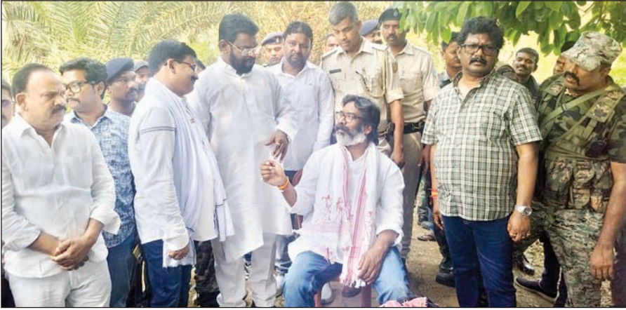
पूर्व सीएम हेमंत सोरेन अपने पैतृक आवास नेमरा पहुंचे और अपने चाचा के श्राद्ध कर्म में शामिल हुए। इस दौरान वे परिवार के लोगों से मिलकर भावुक हो गये। उन्होंने मीडिया से दूरी भी बनायी रखी। श्राद्ध कर्म में शामिल होने के बाद वापस लौट गये।