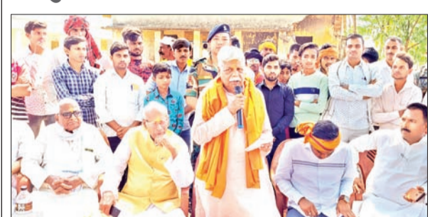
कहा- हारने वाले प्रत्यासी को मतदान करना वोट की बढाई है, इस लिए अबकी बार 400 के आँकड़े को पार करने के लिए मोदी जी के पक्ष में करें मतदान