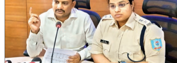
गई है। गणेश लाल अग्रवाल कॉलेज में डीसी व एसपी ने मतदान कर्मियों को आवश्यक निर्देश दिए। पलामू लोकसभा क्षेत्र अंतर्गत कुल 2427 बूथ बनाये गये हैं जहाँ 22,43,034 मतदाता अपने मताधिकार का प्रयोग करेंगे।

मेदिनीनगर। पलामू लोकसभा सीट के लिए 13 मई को होने वाले मतदान को लेकर शनिवार को चुनाव प्रचार का शोर थम गया। हालांकि इस दौरान घर-घर अभियान पर रोक नहीं है। वहीं शनिवार की शाम 5 बजे से लेकर मतदान समाप्ति तक ड्राई डे रहेगा।