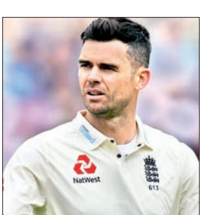
ओर देख रहे हैं और 2025-26 एंशेज की टीम तैयार करना चाहते हैं। दोनों ने इस दौरान गोल्फ भी खेला। फिलहाल एंडरसन ब्रेक पर हैं, काउंटी क्रिकेट नहीं खेल रहे हैं। कहा था कि वर्कलोड मैनेजमेंट के चलते वह मई के अंत तक ही कोई काउंटी मैच खेल पाएंगे।

एजेंसी नई दिल्ली। इंग्लैंड के तेज गेंदबाज जेम्स एंडरसन टेस्ट क्रिकेट से रिटायरमेंट लेने जा रहे हैं। जेम्स एंडरसन ने शनिवार को सोशल मीडिया पर सन्धान की घोषणा की। एंडरसन ने रिटायरमेंट का फैसला इंग्लैंड के टेस्ट कोच ब्रैंडन मैकुलम के साथ बातचीत के बाद लिया। मैकुलम हाल ही में एंडरसन से मिलने के लिए न्यूजीलैंड से इंग्लैंड पहुंचे थे। उन्होंने इस दौरान एंडरसन को बताया कि वह अब भविष्य की