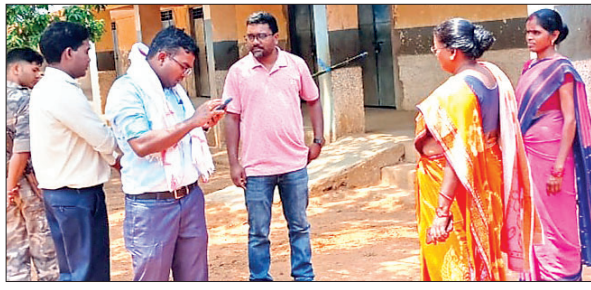
बेड़ो स्थित मतदान केंद्र का निरीक्षण करते प्रखंड निर्वाची पदाधिकारी।

बेड़ो। चौथे चरण के मतदान के लिए चुनावी प्रचार का शोर शनिवार को थम गया। लोहरदगा लोकसभा अंतर्गत बेड़ो प्रखंड में 13 मई को मतदान होना है, जिसकी प्रशासन ने सभी तैयारियां पूरी कर ली है। सोमवार को मतदान सुबह सात बजे से शाम पांच बजे तक चलेगा। इवीएम (इलेक्ट्रॉनिक वोटिंग मशीन) के साथ ही निर्वाचन से संबंधित सामग्री मतदान केंद्रों के लिए रविवार को पोलिंग पार्टियां पहुंचेगी। सभी बूथों पर मतदान के लिए सुरक्षा व्यवस्था का पुख्ता इंतजाम किये गये हैं। प्रखंड में कुल मतदाताओं की संख्या 90 हजार 770 है, जिसमें पुरुष मतदाताओं की संख्या 45 हजार 149 और महिला मतदाताओं की