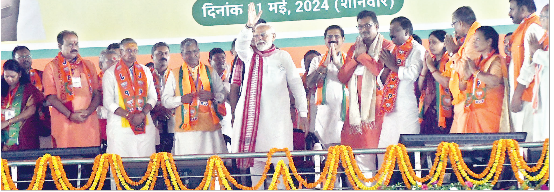
दिनांक 11 मई, 2024 (शनिवार)

सिमरिया। जब विपक्ष बोलता है कि 2024 के लोकसभा चुनाव में मोदी लहर नहीं है, तो उसे झारखंड के सिमरिया आकर देखना चाहिए कि मोदी लहर होती क्या है। शनिवार को प्रधानमंत्री नरेंद्र मोदी को देखने और सुनने जिस हिसाब से भीड़ का जत्था आ रहा था, वह शब्दों में कैसे बर्णन करूं। कठिन लग रहा है। बस समझ लीजिए भीड़ का नजारा ऐसा कि कभी न खत्म होने वाली कड़ी लग रही थी। भीड़ कहां से शुरू और कहां खत्म हो रही थी, उसे पता लगाने के लिए कई किलोमीटर चलना पड़ता। समय करीब दो बजे थे। सिमरिया चौक की तरफ से आजाद सिपाही की टीम सभास्थल की ओर बढ़ रही थी। चौक अचानक से चोक होने लगा। कार्यकर्ताओं और आम लोग पीएम मोदी को देखने के लिए आगे बढ़ रहे थे। सभा करीब साढ़े चार बजे शुरू होनी थी। दूर गांव से लोग पैदल सभास्थल पहुंच रहे थे। क्या युवा, क्या जवान, क्या पुरुष और क्या महिलाएं, बुजुर्ग भी बड़े उत्साह के साथ सभास्थल की ओर तेजी से बढ़ रहे थे। बच्चे भी चहक-चहक कर पीएम का दीदार करने के लिए उत्साह के साथ सभा की ओर आ रहे थे। सिमरिया का मौसम भी साथ दे रहा था। शुरुआत में तो धूप थी, लेकिन