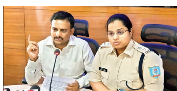
जिला निर्वाचन पदाधिकारी व पुलिस अधीक्षक ने प्रेस वार्ता कर तैयारी की जानकारी दी। उन्होंने बताया कि पलामू लोकसभा अंतर्गत कुल 2427 बूथ बनाये गये हैं जहाँ 22,43,034 मतदाता अपने मतदाधिकार का प्रयोग करेंगे।

मेदिनीनगर। पलामू लोकसभा सीट के लिए 13 मई को होने वाले मतदान को लेकर शनिवार को चुनाव प्रचार का शोर थम गया। हालांकि इस दौरान घर-घर अभियान पर रोक नहीं है। वहीं शनिवार की शाम 5 बजे से लेकर मतदान समाप्ति तक ड्राई डे रहेगा। बाहर से चुनाव प्रचार करने आये लोगों को शहर में रहने की अनुमति नहीं होगी। लाउडस्पीकर का प्रयोग वर्जित रहेगा। इधर, निष्पक्ष व शांतिपूर्ण मतदान करने को लेकर प्रशासन द्वारा आवश्यक तैयारी पूरी कर ली