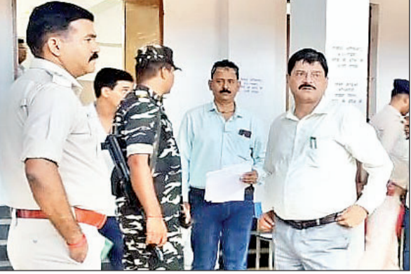
डीसी और एसपी को देखकर मं पोलिंग पार्टी डिस्पैच प्रक्रिया को संपन्न कराया गया।

गढ़वा। जिला अंतर्गत लोकसभा आम निर्वाचन 2024 के तहत मतदान प्रक्रिया संपन्न कराने को लेकर 80- गढ़वा और 81- भवनाथपुर विधानसभा क्षेत्रों के मतदान केंद्रों पर मतदान प्रक्रिया संपन्न कराने को लेकर एसएसजेएस नामधारी कॉलेज गढ़वा में बने डिस्पैच सेंटर से सभी आवश्यक सामग्रियों के साथ सभी मतदान पदाधिकारी (पीठासीन, प्रथम मतदान पदाधिकारी, द्वितीय मतदान पदाधिकारी और तृतीय मतदान पदाधिकारी), सेक्टर पदाधिकारी, सेक्टर पुलिस पदाधिकारी को अपने-अपने निर्धारित मतदान केंद्रों के लिए