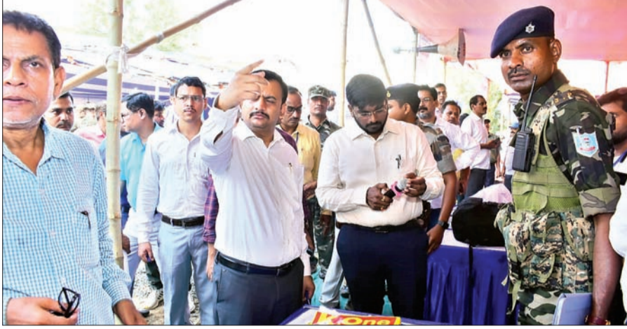
चुनाव से पूर्व मतदान कर्मियों को रवाना करते जिला निर्वाचन पदाधिकारी सह डीसी शशि रंजन।

अहले सुबह से ही शुरू हुए डिस्पैच कार्यों का खुद जिला निर्वाचन पदाधिकारी सह डीसी शशि