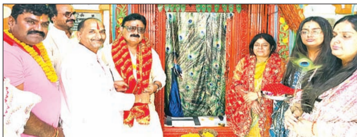
बाबा बंशीधर मंदिर में पूजा-अर्चना करते मंत्री।