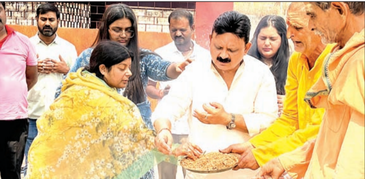
बाबा खोनहर मंदिर में पूजा-अर्चना करते मंत्री और परिवार।