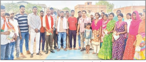
बैठक में शामिल भाजपा कार्यकर्ता।