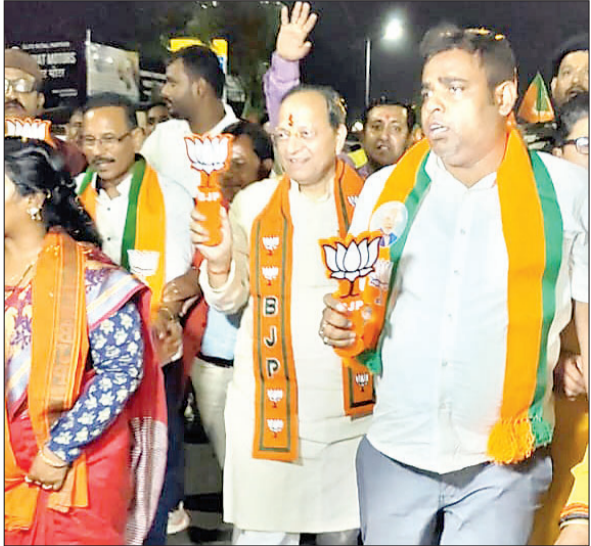
संकल्प को पूरा करने जा रही है। सरकार बनेगी एवं मोदी तीसरी बार देश के प्रधानमंत्री बनेंगे।

आजाद सिपाही संवाददाता रांची। भाजपा के राष्ट्रीय महामंत्री एवं राज्यसभा सांसद अरुण सिंह एक दिवसीय प्रवास पर रांची पहुंचे एवं धुर्वा के हजारों कार्यकर्ताओं के साथ पदयात्रा एवं प्रबुद्ध लोगों से जनसंपर्क कर रांची से भाजपा के लोकसभा प्रत्याशी संजय सेठ के लिए जनसमर्थन मांगा। इससे पूर्व अरुण सिंह ने धुर्वा बस स्टैंड स्थित राम मंदिर में पूजा अर्चना किया। तत्पश्चात पदयात्रा में शामिल हुए। पदयात्रा के उपरांत कार्यकर्ताओं को संबोधित करते हुए राष्ट्रीय महामंत्री अरुण सिंह ने कहा कि पूरे देश में मोदी की लहर चल रही है। इस बार रांची सहित देश की जनता 400 पार के