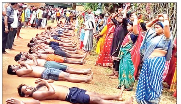
बेड़ो के तुको में मंडा पूजा के दौरान लोटन सेवा करते हुए शिवभक्त।