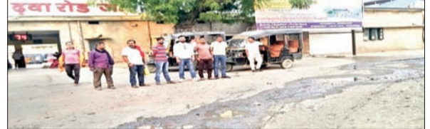
आजाद सिपाही संवाददाता

विश्रामपुर/पलामू। गढ़वा रोड रेलवे स्टेशन के मुख्य द्वार के सामने नाली का बद्बूदार गंदा पानी सड़क के ऊपर से बह रहा है। जिससे स्थानीय लोग, दुकानदार, राहगीर और यात्री काफी परेशान है। वहीं स्टेशन के पास ही योगिबिर बाबा देवस्थल का प्रसिद्ध व प्राचीन मंदिर भी है। जहां प्रतिदिन श्रद्धालु पूजा करने जाते हैं। स्टेशन के सामान्य प्रतीक्षालय के शौचालय से निकल रहा बद्बूदार नाली का गंदा पानी से मंदिर जाने आने वाले श्रद्धालु काफी आहत है। वहीं, छत्तीसगढ़ जाने वाली बस