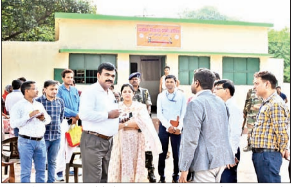
धनबाद में कम मतदान वाले केंद्रों का निरीक्षण करते मुख्य निर्वाचन पदाधिकारी।