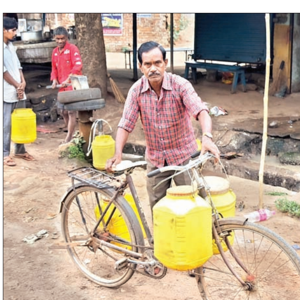
बेड़ो में चापाकल से पानी भर कर ले जाता ग्रामीण।

बेड़ा। प्रखंड मुख्यालय स्थित पीएचईडी विभाग के जिम्मेदारों की लापरवाही के कारण पिछले दो दिनों से पेयजल आपूर्ति सेवा ठप है। इससे बेड़ो के ग्रामीणों को तपती गर्मी में पीने का पानी नहीं मिल रहा है। विभाग की लापरवाही का आलम यह है कि कोई ऐसा महीना नहीं होगा, जिसमें उपभोक्ताओं को पूरे माह पेयजल सप्लाई मिली हो। विभाग के किसी भी अधिकारी को इससे कोई मतलब नहीं है और ना ही वे अपने कार्य क्षेत्र में रहना पसंद करते हैं। और न ही फोन रिसीव करते हैं। लोग पानी के लिए त्रिहामाम कर रहे हैं। वहीं बड़े-बड़े वादे करने वाले जनप्रतिनिधियों को भी इसकी कोई चिंता नहीं है। इससे बेड़ो के लोगों