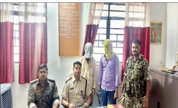
हरिहरगंज/पलामू (आजाद सिपाही)।