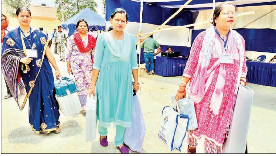
मतदान सामग्री लेकर डिस्पैच सेंटर से रवाना होते मतदान कर्मी।