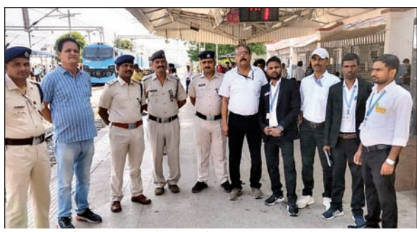
टिकट चेकिंग अभियान में शामिल रेल पदाधिकारी व आरपीएफ जवान