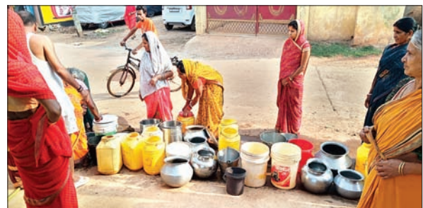
घंटों बिजली सेवा प्रभावित रहने के बाद पीने के पानी के लिए कतारबद्ध होकर अपनी-अपनी बारी का इंतजार करते लोग।