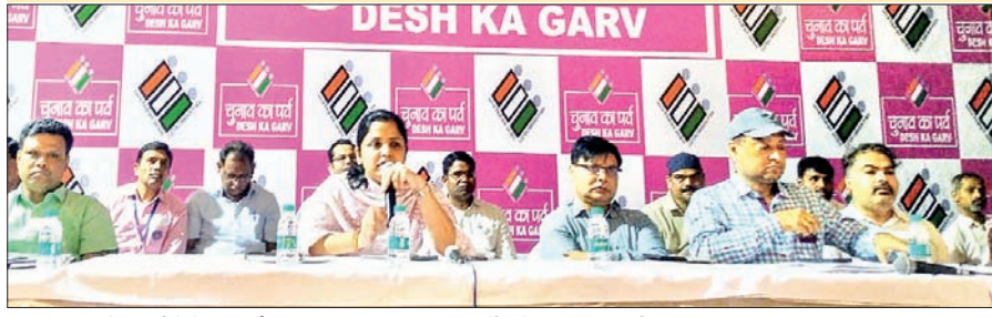
पदाधिकारियों-कर्मियों के साथ बैठक कर आवश्यक दिशा-निर्देश देती जिला निर्वाचन पदाधिकारी माधवी मिश्रा व अन्य।

लिए रिसीविंग सेंटर में प्रतिनियुक्त कर्मी व पदाधिकारियों को संबोधित कर रही थीं। उन्होंने कहा कि इवीएम और अन्य चुनावी सामग्री रिसीविंग करते समय किसी प्रकार की लापरवाही नहीं बरते। निर्वाचन के सभी डॉक्यूमेंट अति महत्वपूर्ण हैं। इसलिए गंभीरता से अपनी ड्यूटी करें। अपने-अपने काउंटर और प्राप्त होने वाले