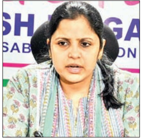
- सभी मतदाताओं से लोकतंत्र के महापर्व में हिस्सेदारी निभाने की अपील - चुनाव सामग्री रिसीव करने के बाद त्वरित रिजल्ट की जाएगी गाड़ियां