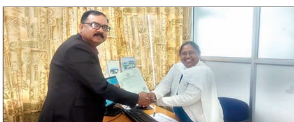
एमओयू पर हस्ताक्षर कर सौंपते पदाधिकारी।

बेरमो। झारखंड शिक्षा परियोजना परिषद (जेडपीसी) ने अगले तीन वर्षों के लिए स्विचऑन फाउंडेशन के साथ समझौता ज्ञापन (एमओयू) पर हस्ताक्षर किया है। जिसका उद्देश्य विद्यार्थियों को पर्यावरणीय स्थिरता और जलवायु परिवर्तन के लिए कार्रवाई करने को सशक्त बनाना है। इससे झारखंड के 11 जिलों धनबाद, बोकारो, रामगढ़, साहेबगंज, पूर्वी सिंहभूम, पश्चिमी सिंहभूम, देवघर, गोड्डा, कोडरमा, गिरिडीह और रांची में पर्यावरण के प्रति जागरूक नागरिकों की एक पीढ़ी को बढ़ावा दिया जा सके। एमओयू की एक खास बात यह है कि यह विद्यार्थियों को 'एन्वाइरन' नामक एक ऑनलाइन प्लेटफॉर्म के माध्यम से पर्यावरण शिक्षा प्रदान