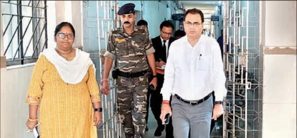
रांची के होटवार बिरसा मुंडा केंद्रीय कारा का निरीक्षण करते न्यायायुक्त।

आजाद सिपाही संवाददाता अनगड़ा । सभी को अपने बातों को रखने का पूर्ण अधिकार है, जिन्हें किसी भी प्रकार की परेशानी हो वे न्यायालय से संपर्क कर अपनी समस्या को रख सकते हैं। उक्त बातें गुरुवार को रांची के होटवार स्थित बिरसा मुंडा केंद्रीय कारा में रांची न्यायायुक्त दिवाकर पांडे ने कही। वे कारा में आयोजित विधिक जागरूकता शिविर एवं निरीक्षण के बोल रहे थे। न्यायायुक्त ने बंदियों से समस्याएं सुनी और कहा कि वैसे बंदी जिनका बेल हो चुका है और वह