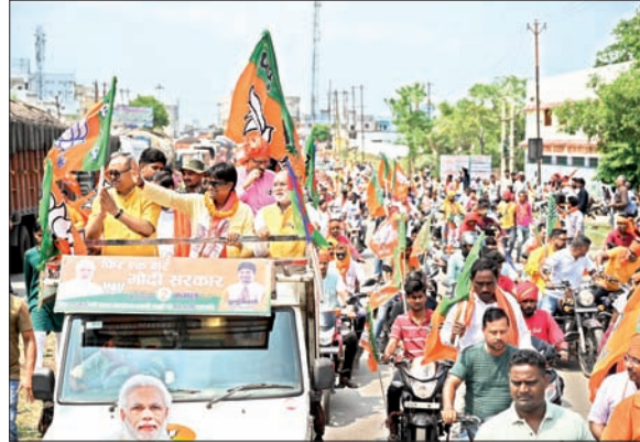
आजाद सिपाही संवाददाता

सशक्त राष्ट्र और धनबाद के नवनिर्माण के लिए भाजपा को वोट करें : दुल्लू