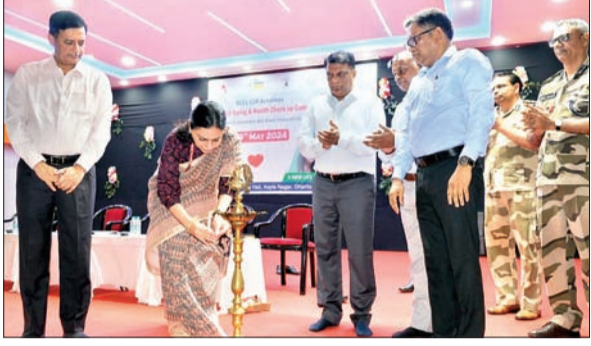
कार्यक्रम का उद्घाटन करते गणमान्य लोग।

धनबाद। थैलेसीमिया बाल सेवा योजना के अंतर्गत बीसीसीएल सीएसआर गतिविधियों के तहत बीसीसीएल और सीआइएसएफ की ओर से कोयला नगर स्थित सामुदायिक सभागार में संयुक्त रूप से थैलेसीमिया जांच और स्वास्थ्य योजना से संबंधित जांच शिविर आयोजित की गई। जिसका उद्घाटन कोयला मंत्रालय की अपर सचिव रुपिंदर बरार ने किया। वह तीन दिवसीय दौर पर बीसीसीएल आई हुई है। यह कार्यक्रम बीसीसीएल की ओर से सीआइएसएल गतिविधियों में के तहत आयोजित