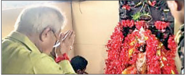
झारखंड के आदिवासी बेहद सरल और देशभक्त : वाजपेयी

तमाड़ा। लोकसभा चुनाव के अंतिम चरण की वोटिंग का प्रचार समाप्त होने से पहले भाजपा के झारखंड प्रभारी ने राजधानी रांची के तमाड़ा स्थित प्रसिद्ध दिउड़ी मंदिर में पूजा-अर्चना की। उन्होंने दावा किया कि झारखंड की सभी 14 लोकसभा सीटों पर भाजपा के उम्मीदवारों की जीत होगी।