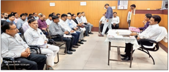
विभिन्न विभाग के अधिकारियों के साथ बैठक करते प्रधान जिला जज।