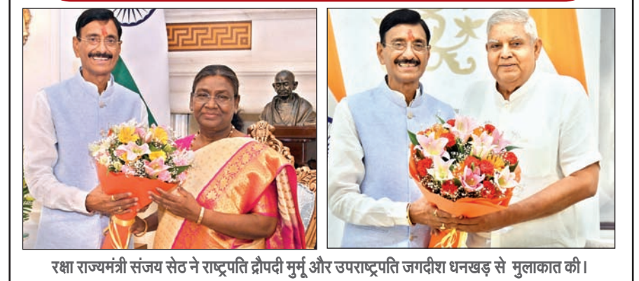
रक्षा राज्यमंत्री संजय सेठ ने राष्ट्रपति द्रौपदी मुर्मू और उपराष्ट्रपति जगदीश धनखड़ से मुलाकात की।