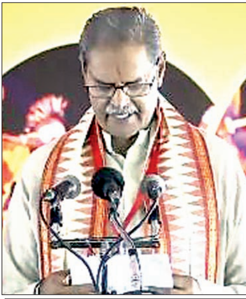
डिप्टी सीएम की शपथ लेते कनक वर्धन सिंहदेव।