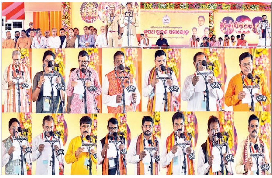
मंच पर मौजूद गणमान्य लोग और मंत्री की शपथ लेते विधायकगण।