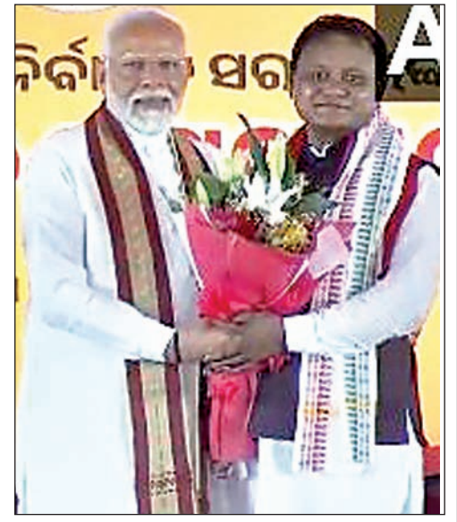
नये सीएम मोहन चरण माझी को बधाई देते पीएम।