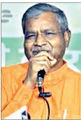
बाबूलाल मरांडी की फाइल फोटो।

आजाद सिपाही संवाददाता मेदिनीनगर। भाजपा के प्रदेश अध्यक्ष बाबूलाल मरांडी ने कहा कि पलामू सहित पूरे प्रदेश में बिजली और पानी देने में भी झारखंड की गठबंधन सरकार फेल साबित हो रही है। केंद्र सरकार की नल-जल योजना का लाभ दिलाने में भी राज्य सरकार फेल हो गयी है। थोड़ा बहुत काम हुआ है, लेकिन उसकी भी स्थिति ठीक नहीं है। लोगों को पर्याप्त बिजली-पानी मिले, इसके लिए युद्धस्तर पर अभी भी कार्य करने की जरूरत है। बिजली नहीं मिलने के कारण व्यवसाय ठप है। बाबूलाल मरांडी ने कहा कि पलामू का अधिकतम तापमान हर दिन 45 डिग्री को पार कर रहा है। ऐसे में एसी तक काम करना बंद कर दिया है। अधिकारियों से जब पूछा जा रहा है, तो वे सुधार