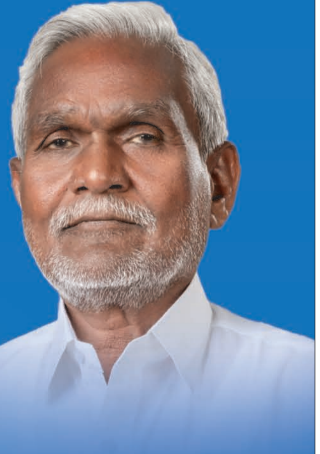
श्री चम्पाई सोरेन मुख्यमंत्री, झारखण्ड

इलेक्ट्रॉनिक संसाधनों के व्यापक इस्तेमाल पर जोर दिया गया है, इसमें ऑडियो-वीडियो संसाधनों के साथ-साथ इलेक्ट्रॉनिक सूचना माध्यम का भी इस्तेमाल किया जा सकेगा।