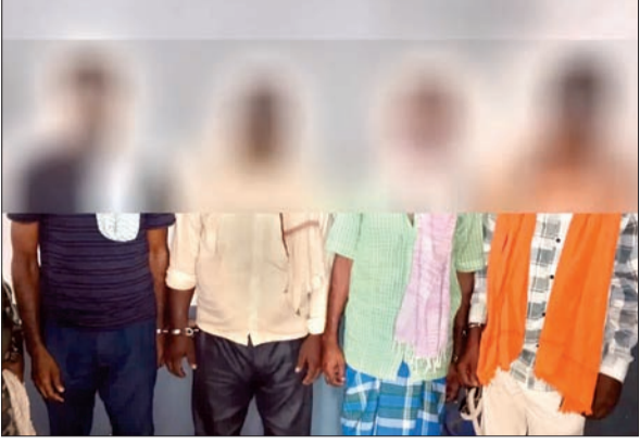
पुलिस की गिरफ्त में विभिन्न आपराधिक घटनाओं में शामिल नक्सली।