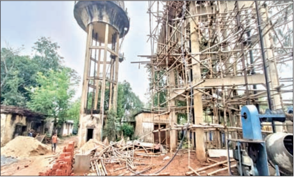
दिया। हालांकि कुछ देर बाद पुनः दूसरे साइड के बालू से प्लास्टर का काम शुरू कर दिया गया। दूसरी ओर, ग्रामीणों ने कहा कि ठेकेदार को बार-बार कहने और समझाने के बाद भी लगातार घंटिया सामग्री से पानी टंकी का निर्माण कार्य कराया जा रहा है। ग्रामीणों ने यहां के जिम्मेदार लोगों को कोसते हुए कहा कि घंटिया सामग्री से बेड़ो में बन रहा पानी टंकी कितना गुणवत्ता का होगा यह सभी जानते हैं, लेकिन सभी ने चुप्पी साध रखी है। ग्रामीणों ने उच्च अधिकारियों से पानी टंकी निर्माण में बरती जा रही अनियमितता की जांच करने की मांग की है।

बेड़ो। प्रखंड मुख्यालय स्थित पेयजल आपूर्ति विभाग परिसर में पिछले कई वर्षों की मांग के बाद बन रहे जलमीनार में ठेकेदार की ओर से भारी अनियमितता बरती जा रही है। जिसे लेकर ग्रामीणों में भारी आक्रोश है। उनका कहना है कि इस जलमीनार के निर्माण कार्य में शुरू से ही अनियमितता बरती जा रही है। ठेकेदार ग्रामीण की बातों को नजर अंदाज कर लगातार घंटिया सामग्री से जलमीनार का निर्माण करा रहा है। बुधवार की सुबह ग्रामीणों ने देखा कि मजदूर पानी टंकी में प्लास्टर के लिए मिट्टी युक्त बालू का इस्तेमाल कर रहे हैं। यह देख ग्रामीणों ने इसका विरोध किया और तुरंत प्लास्टर का काम रोक