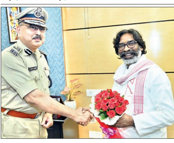
सीएम हेमंत सोरेन को बधाई देते पुलिस महानिदेशक अजय कुमार सिंह।