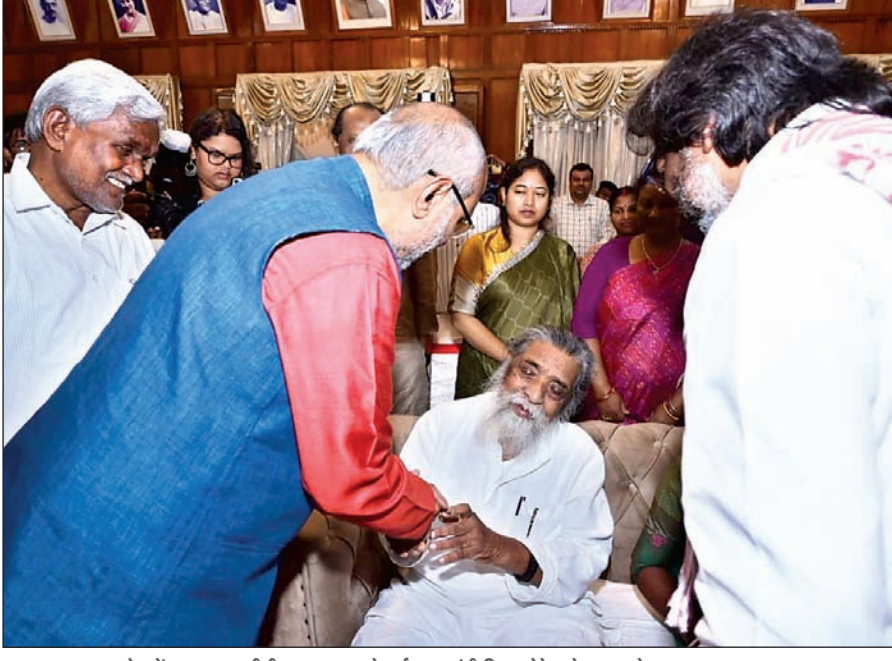
शपथ ग्रहण समारोह में राज्यपाल सीपी राधाकृष्णन ने पूर्व मुख्यमंत्री शिवू सोरेन से कुरालक्षेम जाना।