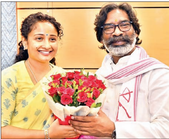
सीएम हेमंत सोरेन को बधाई देती उनकी पत्नी कल्पना सोरेन।