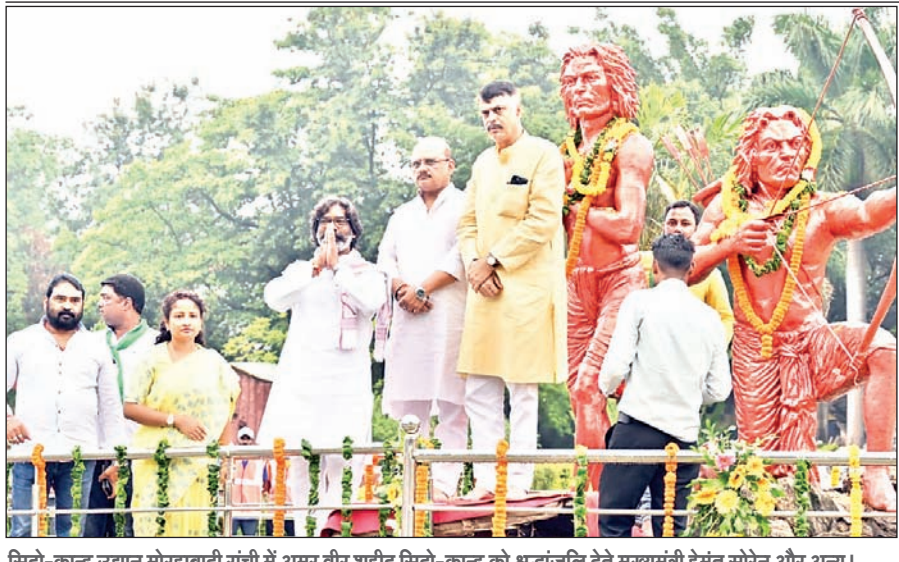
सिद्धो-कान्हू उद्यान मोरहाबादी रांची में अमर वीर शहीद सिद्धो-कान्हू को श्रद्धांजलि देते मुख्यमंत्री हेमंत सोरेन और अन्य।