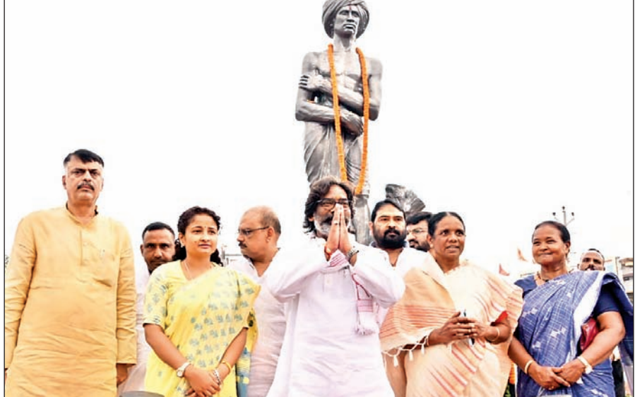
बिरसा चौक, रांची में भगवान बिरसा मुंडा की प्रतिमा पर माल्यार्पण कर श्रद्धा-सुमन अर्पित करते हुए मुख्यमंत्री हेमंत सोरेन।