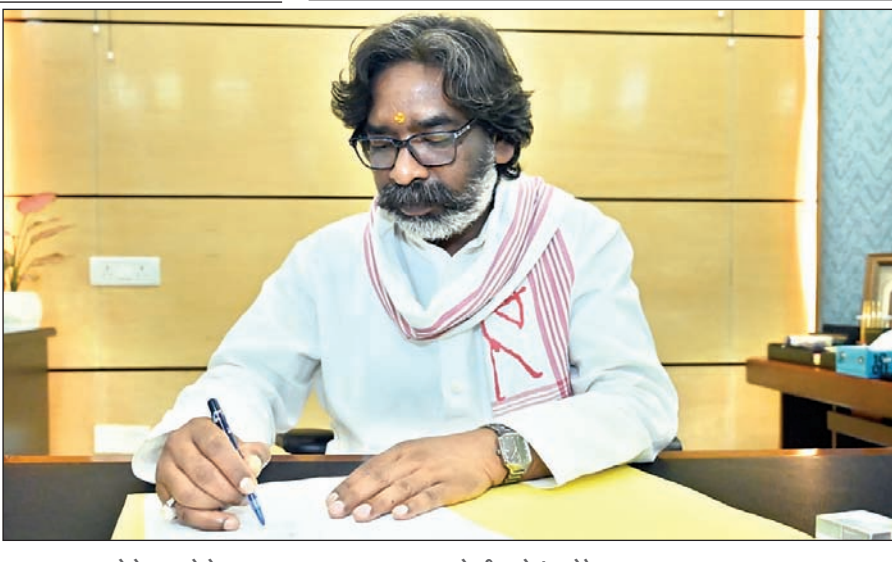
शपथ ग्रहण करने के बाद प्रोजेक्ट भवन जाकर पदभार ग्रहण करते सीएम हेमंत सोरेन।

रांची (आजाद सिपाही)। झामुमो के कार्यकारी अध्यक्ष हेमंत सोरेन ने मुख्यमंत्री पद की शपथ ली। इस अवसर पर झामुमो के नेताओं और कार्यकर्ताओं ने आतिशबाजी की। अबीर -गुलाल के साथ मिठाई बांट कर एक-दूसरे को बधाई दी और एक स्वर से कहा कि असत्य पर सत्य की जीत हुई