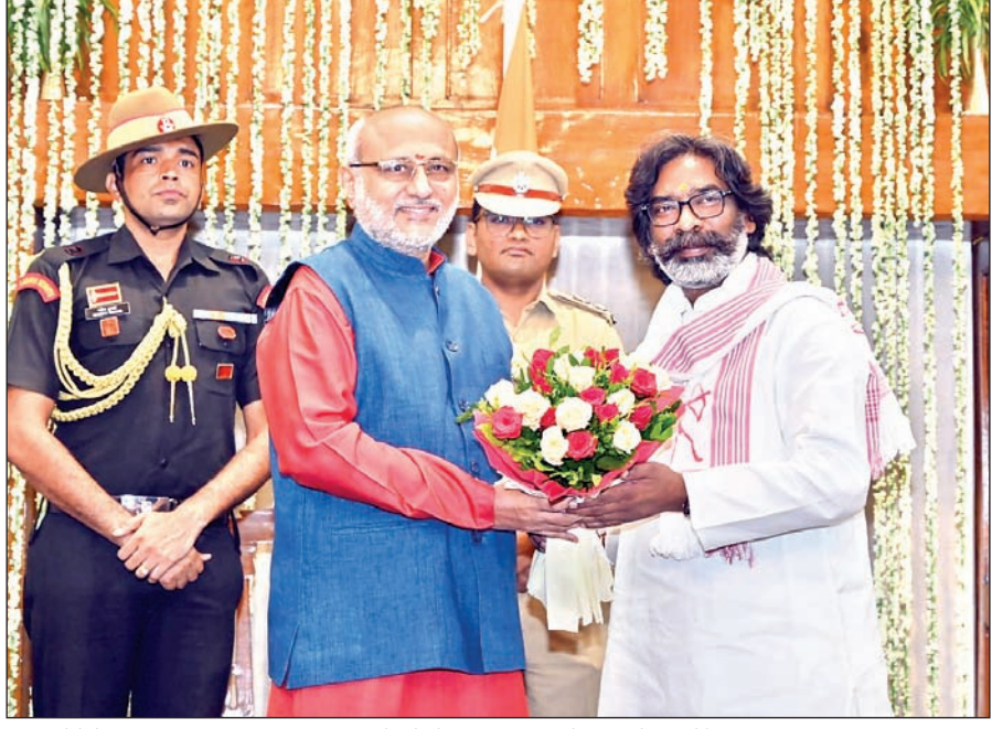
शपथ लेने के बाद राज्यपाल सीपी राधाकृष्णन को बुके देकर स्वागत करते सीएम हेमंत सोरेन।

कांग्रेस और राजद के समर्थन से हेमंत 2019 में सत्ता में आये। तमाम समस्याओं के बीच हेमंत सोरेन ने खुद को राज्य के प्रभुत्वशाली आदिवासी समुदाय की एक मजबूत आवाज के रूप में स्थापित किया। वह राज्य में खनन गतिविधियों का आर्थिक लाभ आदिवासियों तक पहुंचाने के भी प्रबल समर्थक रहे हैं।