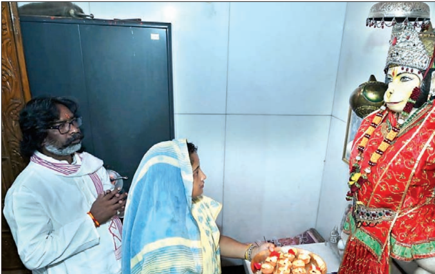
मुख्यमंत्री आवास परिसर स्थित मंदिर में पूजा-अर्चना करते मुख्यमंत्री हेमंत सोरेन और पत्नी कल्पना सोरेन।