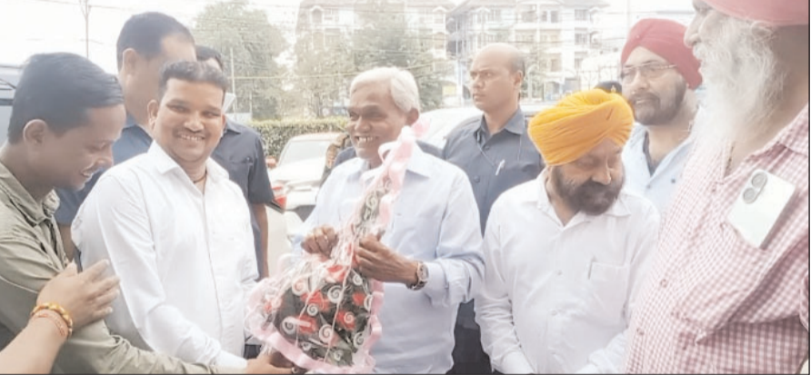
संतोषजनक बताया। कहा उन्हें जितना भी मौका मिला राज्य की जनता के लिए बेहतर से बेहतर

आजाद सिपाही संवाददाता सरायकेला। पूर्व सीएम चंपाई सोरेन शुक्रवार को अपने गृह जिला सरायकेला पहुंचे। जहां जगह-जगह उनके समर्थकों और पार्टी कार्यकर्ताओं ने गर्मजोशी से स्वागत किया। इस दौरान पूर्व सीएम चंपाई सोरेन थोड़े भावुक नजर आये, लेकिन उन्होंने अपने समर्थकों को भरोसा दिलाया। उनके हक और अधिकार की लड़ाई जारी रहेगी। मीडिया से वार्ता के दौरान कहा पूर्व सीएम ने अपने 5 महीने के कार्यकाल को