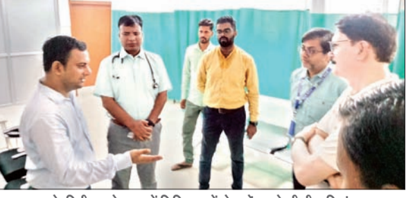
अस्पताल के निरीक्षण के क्रम में चिकित्सकों से बाते करते डीसी शशि रंजन।

मेदिनीनगर। पलामू डीसी शशि रंजन ने शुक्रवार को एमएमसीएच का औचक निरीक्षण किया। उन्होंने एमएमसीएच में भर्ती मरीजों को उपलब्ध कराया जा रही स्वास्थ्य सुविधाओं का जायजा लिया। निरीक्षण के दौरान सर्वप्रथम डीसी ने इमरजेंसी के प्रत्येक वार्ड का अवलोकन किया। उन्होंने सिविल सर्जन को पुराने