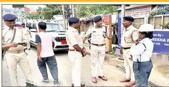
कार्य करने वाले ट्रैफिक पुलिस को मनोबल बढ़ाये रखने के लिए पुरस्कृत भी किया जायेगा। जिसमें गाड़ीखाना चौक पर

रांची (आजाद सिपाही)। रांची रेंज के डीआइजी अनूप बिश्नेर ने ट्रैफिक पोस्ट पर तैनात जवानों का ब्रीफिंग किया। बुधवार को डीआइजी ने हॉटलिप्स चौक से अरगोड़ा चौक तक के सभी ट्रैफिक पोस्टों पर तैनात पुलिसकर्मियों को यातायात सुगम बनाने और आम लोगों से सभ्य और अनुशासित व्यवहार करने के लिए किन-किन बातों को ध्यान रखना चाहिए, इसके संबंध में ब्रीफिंग की। इसके अलावा ट्रैफिक पोस्टों में अच्छे