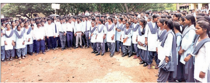
बड़े प्रखंड कार्यालय के समीप विभिन्न गांवों को लेकर प्रदर्शन करते विद्यार्थी।

ग्रामीण क्षेत्रों में बेहतर शिक्षा और व्यवस्था देने के नाम पर शिक्षा विभाग लाखों रुपये खर्च कर रहा है, फिर भी स्कूल में पेयजल, शौचालय गवन बेंच डेस्क का अभाव