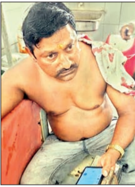
ग्रामीण को गंभीर चोट लगने के कारण हजारीबाग रेफर किया गया।