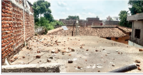
शांति समिति के सदस्यों के साथ बैठक करते पुलिस के आला अधिकारी। पत्थरबाजी के बाद क्षेत्र में फैले इंटर-पत्थर के अवशेष