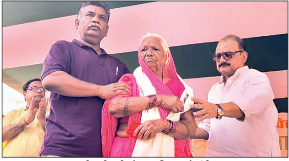
शहीद की पत्नी को सम्मानित करते मंत्री।

अटौला में स्वतंत्रता सेनानी सह शहीद द्वार का मंत्री ने किया लोकार्पण मंत्री के निजी कोश से मध्य शहीद द्वार का हुआ निर्माण सभी शहीदों एवं स्वतंत्रता सेनानियों के परिजनों को मंत्री ने किया सम्मानित