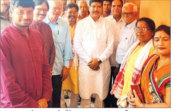
स्कूल भवन के उद्घाटन के मौके पर राज्यसभा सांसद आदित्य साहू व अन्य।