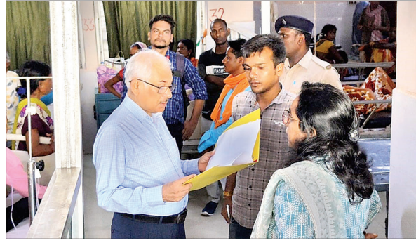
एसएनएमएमसीएच में विभिन्न विभागों का निरीक्षण करती एडीएम (कानून व्यवस्था)।