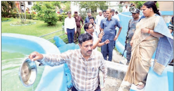
ली। निरीक्षण के दौरान वह