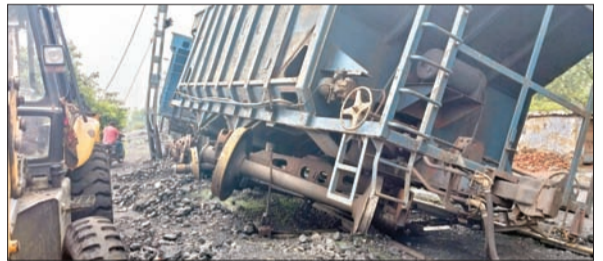
आजाद सिपाही संवाददाता

फुसरो/बेरमो। सीसीएल डोरी क्षेत्र के एडीओसीएम परियोजना के पांच नंबर धौड़ा स्थित रेलवे साइडिंग के समीप रविवार अहले सुबह 4.30 बजे मालगाड़ी की दो बोगियां बेपटरी हो गयीं। उक्त मालगाड़ी में 59 डिब्बे लगे थे। पर दो बोगी डैमज होने के कारण उसने कोयला लोड नहीं किया गया था। घटना के संबंध में बताया जा रहा कि मालगाड़ी सीसीएल डोरी के अमलो रेलवे साइडिंग के प्लेट फार्म संख्या 2 से कोयला लाद कर फुसरो स्टेशन के लिए