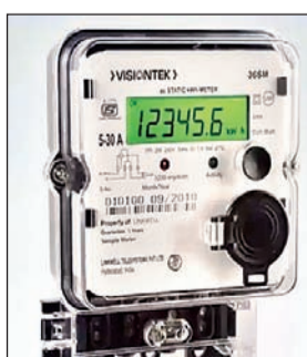
जेबीवीएनएल की ओर से रांची और धनबाद में स्मार्ट मीटर

समेत बिजली संबंधी अन्य जानकारी व्हाट्सएप पर ले सकते हैं। वहीं, जेबीवीएनएल के पास जिन उपभोक्ताओं का रजिस्टर्ड व्हाट्सएप नंबर है, उन्हें व्हाट्सएप मैसेज के जरिये इसकी जानकारी दी गयी है। जेबीवीएनएल के मोबाइल नंबर 9431135503 पर व्हाट्सएप से जुड़ सकते हैं। किसी भी प्रकार की समस्या होने पर टॉल फ्री नंबर 1912 या 1800-345-6570 या 0651-2710002 पर संपर्क करें।