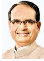
शिवराज सिंह चौहान

कृषि विकास और किसान कल्याण हमारी सर्वोच्च प्राथमिकता है। अन्न के माध्यम से हमारे जीवन संचालन के सूत्रधार अन्नदाता के जीवन में सुख-समृद्धि लाना हमारा संकल्प है। इस संकल्प की पूर्ति के लिए हम हरसंभव प्रयास करेंगे। किसान की आय बढ़ाने के लिए हमने छह सूत्रीय रणनीति बनायी है। उत्पादन बढ़ाना, खेती की लागत घटाना, उत्पादन के ठीक दाम दिलाना, प्राकृतिक आपदा में राहत की उचित राशि दिलाना, कृषि का विविधीकरण तथा प्राकृतिक खेती को बढ़ावा देना इसके अहम पहलू हैं। उत्पादन बढ़ाने और लागत घटाने के लिए सबसे जरूरी हैं अच्छे बीज, जो कम पानी और विपरीत मौसम में भी बेहतर उत्पादन में सक्षम हो सकें। ऐसे बीजों की 109 नयी किस्मों को प्रधानमंत्री नरेंद्र मोदी ने राष्ट्र और किसानों को समर्पित किया है।