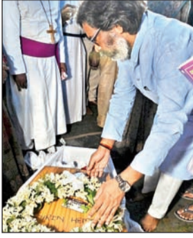
साहिबगंज और पाकुड़ के हजारों कार्यकर्ता श्रद्धांजलि सभा में हुए शामिल