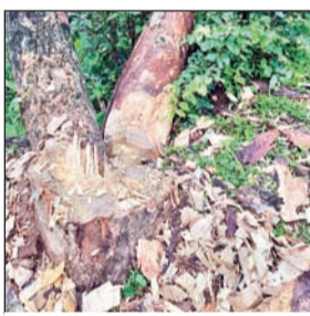
काटे गये हरे पेड़।

भवनाथपुर। वन कर्मियों के हड़ताल पर चले जाने के कारण भवनाथपुर उत्तरी वनक्षेत्र में इन दिनों बड़े पैमाने पर जंगलों से हरे पेड़ काटे जा रहे हैं। उत्तरी वनक्षेत्र के कैलान, घाघरा, कर्माही, फुलवार सुरक्षित वन क्षेत्र से बेखोफ होकर ग्रामीण तेजी से पेड़ काट कर जंगलों के भूमि पर अतिक्रमण कर झोपड़ी लगा कर खेती कर रहे हैं। जंगलों से सिधा, सखुआ, बांस, चिलबिल, सलई जैसे किमती पेड़ों को काट रहे हैं। पिछले 16 अगस्त से वनकर्मियों के हड़ताल पर चले जाने के कारण जंगलों की कटाई में वृद्धि हुई है। हड़ताल में जाने के कारण