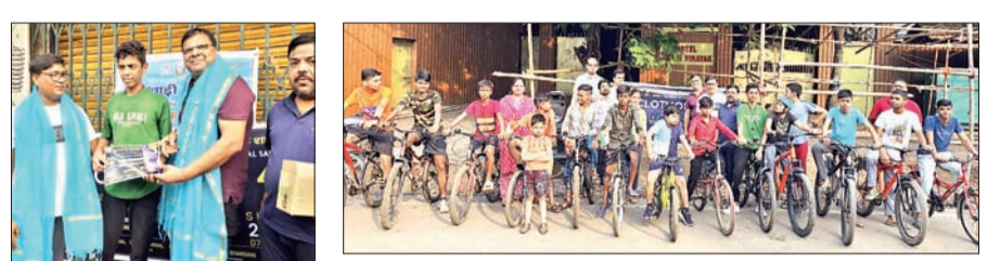
साइक्लोथोन 4.0 में शामिल प्रतिभागी।

मायूम कोयलांचल शाखा ने राष्ट्रीय खेल दिवस पर किया साइक्लोथोन 4.0 का आयोजन आजाद सिपाही संवाददाता धनबाद। राष्ट्रीय खेल दिवस पर युवाओं में खेल के महत्व और शारीरिक स्वस्थता के बारे में जागरूकता बढ़ाने को लेकर अखिल भारतीय मारवाड़ी युवा मंच के आह्वान पर मारवाड़ी युवा मंच धनबाद कोयलांचल के तत्वाधान में रविवार को साइक्लोथोन 4.0 (साइकिल रैली) का आयोजन किया गया। कार्यक्रम का शुरुआत में झारखंड