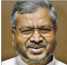
पारितोषिक के समान हैं, जितना जोर लागाना है, लगा लीजिए, जितने केस मुकदमे दर्ज करने हैं, कर दीजिए। भाजपा युवाओं की लड़ाई सड़क से लेकर सदन तक

रांची। रांची के मोरहाबादी मैदान में 23 अगस्त को आयोजित युवा आक्रोश रैली के बाद भाजपा नेताओं पर हुई एफआइआर पर भाजपा प्रदेश अध्यक्ष बाबूलाल मरांडी ने मुख्यमंत्री हेमंत सोरेन पर निशाना साधा है। बाबूलाल ने रिवार को एक्स पर एक पोस्ट कर कहा कि सूचना मिली है कि मोरहाबादी मैदान में आयोजित युवा आक्रोश रैली की सफलता से तिमिलता कर मुख्यमंत्री हेमंत सोरेन ने मुझ पर और भाजपा के नेताओं और कार्यकर्ताओं सहित हजारों युवा साथियों पर मुकदमा दर्ज कराया है। इस एफआइआर के लिए सोरेन राजघराने के एक्सीडेंटल राजकुमार हेमंत सोरेन और उनकी 2020 खतियानधारी दलाल-विचौलिया मित्र मंडली का आभार।