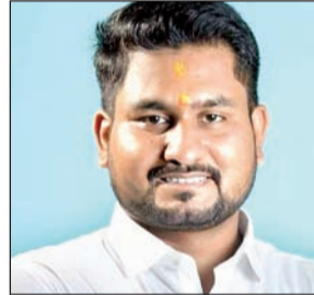
उच्च शिक्षा मंत्री ने अपनी राय व्यक्त करते हुए कहा कि प्रवेश प्रक्रिया में यह संशोधन कई छात्रों को एक नया अवसर प्रदान करेगा। उन्होंने कहा, "हमारे छात्र हमारे राज्य और देश का भविष्य हैं।"

भुवनेश्वर। वर्तमान शैक्षणिक वर्ष 2024-25 में प्लस-3 द्वितीय चरण की आवेदन प्रक्रिया को लेकर उच्च शिक्षा विभाग द्वारा एक महत्वपूर्ण निर्णय लिया गया है। जिन छात्रों ने पहले चरण में भाग लिया है और पहले ही प्लस-3 पाठ्यक्रम में दाखिला ले लिया है, वे प्रवेश प्रक्रिया के दूसरे चरण में भी भाग ले सकते हैं।