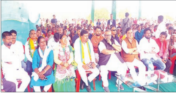
लोगों के साथ बैठकर पीएम के मन की बात सुनते असम के मुख्यमंत्री।

नामकुम । प्रखंड के हुआंगहातू गांव में असम के मुख्यमंत्री सह झारखंड भाजपा के प्रभारी हिमंता बिस्वा सरमा ने रविवार को सैकड़ों ग्रामीणों के साथ पीएम मोदी के मन की बात कार्यक्रम को सुना और लोगों से बातचीत की। इससे पहले आदिवासी पारंपरिक रीति रिवाज से उनका स्वागत किया गया। इस अवसर पर उन्होंने कहा कि हमने अपने आदिवासी भाइयों के साथ झारखंड में पीएम मोदी के मन की बातों को सुना। यह मेरे लिए गर्व की बात है। उन्होंने राज्य सरकार पर आरोप लगाते हुए कहा कि यहां के मुख्यमंत्री बार-बार कहते हैं कि काम किया है। अगर उन्होंने वास्तव में काम किया है तो उन्हें यह बताना चाहिए कि उन्होंने