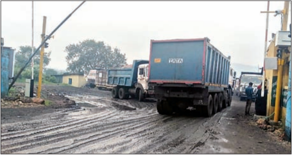
एना फायर परियोजना में हंगामे के बाद पसरा सन्नाटा व खड़ा वाहन।