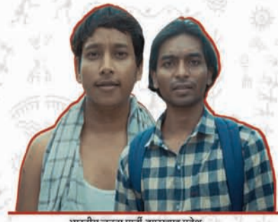
भारतीय जनता पार्टी, झारखंड प्रदेश