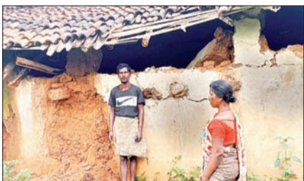
जंगली हाथियों के द्वारा तोड़ा गया घर।