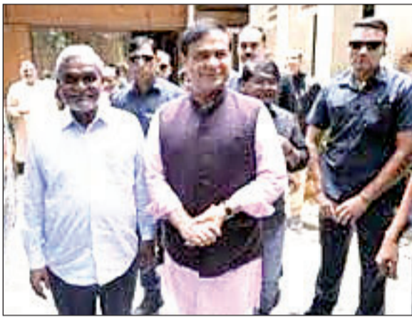
आमंत्रण दिया। उल्लेखनीय है कि चंपाई सोरेन ने शुक्रवार को झामुमो पर अपमानित करने का आरोप लगाते हुए भाजपा का

रांची। असम के मुख्यमंत्री हिमंता बिस्वा सरमा ने शनिवार को चंपाई सोरेन से मुलाकात की। इस दौरान उन्होंने झारखंड के पूर्व मुख्यमंत्री को असम में मां कामाख्या देवी मंदिर का दर्शन करने के लिए निमंत्रण दिया। चंपाई सोरेन ने एक्स पर यह जानकारी दी।