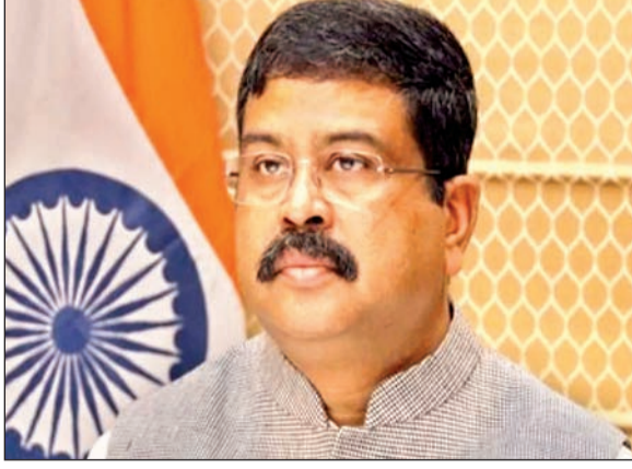
केंद्रीय मंत्री ने कहा कि बार-बार अनुसूचित के बावजूद तमिलनाडु ने पीएम श्री योजना से संबंधित समझौता ज्ञान पर अभी तक हस्ताक्षर नहीं किये हैं। शिक्षा मंत्री ने श्री स्टालिन से पीएम श्री योजना के लिए केंद्र के साथ समझौता ज्ञान पर हस्ताक्षर करने का आग्रह भी किया। उन्होंने कहा कि

नयी दिल्ली। केंद्रीय शिक्षा मंत्री धर्मेंद्र प्रधान ने तमिलनाडु के मुख्यमंत्री एमके स्टालिन को पत्र लिखकर केंद्र सरकार की प्रतिबद्धता दोहराते हुए यह सुनिश्चित करने के लिए कहा कि देश के प्रत्येक बच्चे की राष्ट्रीय शिक्षा नीति- 2020 के परिवर्तनकारी लाभों तक पहुंच हो। उन्होंने मुख्यमंत्री को लिखे पत्र में इस बात पर प्रकाश डाला कि तमिलनाडु राज्य के लाखों विद्यार्थियों को समग्र शिक्षा योजना से लाभ हुआ है। शिक्षा मंत्री ने इस बात पर बल दिया कि राष्ट्रीय शिक्षा नीति-2020 तमिलनाडु के स्कूलों में तमिल पढ़ाने का पूरी तरह से समर्थन करती है। श्री प्रधान ने कहा कि तमिल दुनिया की सबसे पुरानी भाषाओं में से एक है। उन्होंने कहा कि तमिल भाषा राष्ट्रीय गौरव का विषय है।