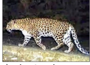
मौत हो गयी। इसके साथ एक व्यक्ति गंभीर रूप से घायल हो गया

भुवनेश्वर। तेंदुआ के हमले में तीन साल के बच्चे की मौत हो गयी। नबरंगपुर सीमा के घमतेरी इलाके में घर के पास खेलते समय तेंदुआ ने बच्चे को ले गया। कुछ दिनों के अंतराल के बाद तेंदुआ ने फिर से हमला किया है। तेंदुआ के हमले में तीन साल के बच्चे की