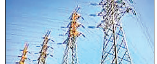
का अतिरिक्त समय दिया गया है। ये उपभोक्ता अक्टूबर के पहले तक बकाया बिजली बिल भुगतान कर दें, जिससे प्रीपेड स्मार्ट मीटर का लाभ ले सकेंगे। जेबीवीएनएल के अनुसार 2 और 3 सितंबर को राज्य भर में कैंप लगाया जायेगा। वहां

रांची। बिजली की नयी व्यवस्था राज्य में 1 सितंबर से लागू हो जायेगी। इसके तहत 1 सितंबर से राजधानी में लगे स्मार्ट मीटर प्रीपेड मोड पर काम करना शुरू कर देंगे। 1 सितंबर से उन उपभोक्ताओं के स्मार्ट मीटर प्रीपेड मोड पर काम करेंगे, जिनका पूर्व से कोई बकाया नहीं है। यानी ये उपभोक्ता मीटर रीचार्ज कर बिजली बिल जलाने का लाभ लेंगे। वहीं, झारखंड बिजली वितरण निगम के जीएम आइटी सह जीएम कॉमर्शियल संजय सिंह ने बताया कि जिन उपभोक्ताओं का बकाया शेष है, ऐसे उपभोक्ताओं को एक महीने