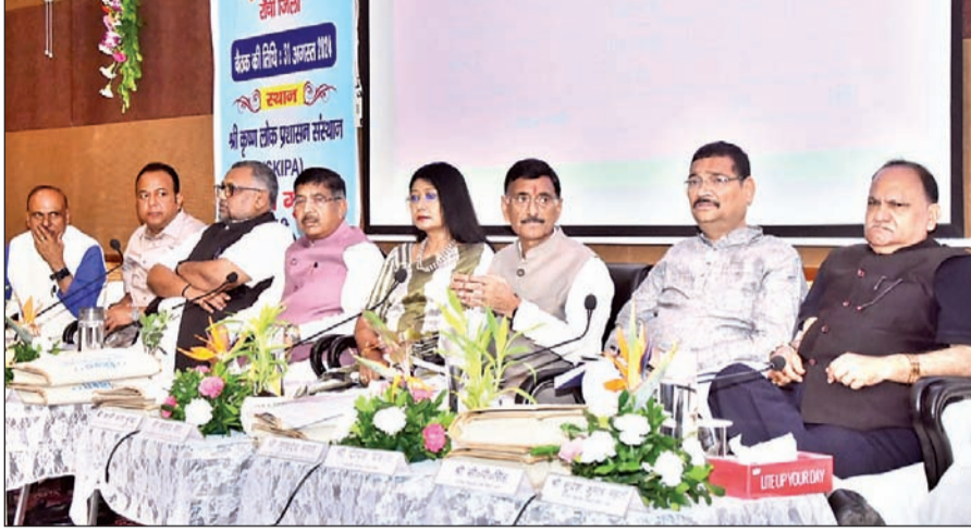
अनुपलब्धता, जीवित व्यक्तियों को मृत बताकर उनकी वृद्धा पेंशन रोकने वाले अधिकारियों पर कार्रवाई और जल जीवन मिशन में भारी गड़बड़ी शामिल हैं। उपायुक्त ने सभी अधिकारियों को विकास कार्यों में जनप्रतिनिधियों की भागीदारी सुनिश्चित करने का निर्देश दिया। बैठक में रक्षा राज्य

आजाद सिपाही संवाददाता रांची। लोकसभा चुनाव के बाद पहली बार शनिवार को रांची जिला दिशा समिति की बैठक संपन्न हुई। इस बैठक की अध्यक्षता केंद्रीय रक्षा राज्य मंत्री सह रांची के सांसद संजय सेठ ने की। बैठक में उन्होंने अधिकारियों को समय के पाबंद होने की बात कही और हर 3 महीने में दिशा की बैठक सुनिश्चित करने का निर्देश दिया। बैठक में जनप्रतिनिधियों ने विभिन्न क्षेत्रों से जुड़े अलग-अलग मुद्दे उठाये, जिनमें अनुआ आवास योजना में भ्रष्टाचार, प्रधानमंत्री ग्राम सड़क योजना की स्थिति, रांची शहर में जुड़को और नगर निगम के द्वारा सड़कों पर गड्डे खोदे जाने, बालू की