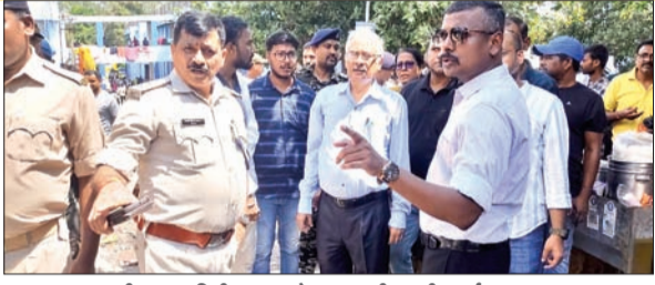
एसएनएमएसपीएच का निरीक्षण करते एसएसपी एचपी जर्नादनन।

एसएनएमएसपीएच परिसर में आने-जाने के सभी अनावश्यक रास्तों को बंद कर एक मुख्य रास्ता बनाएं आजाद सिपाही संवाददाता