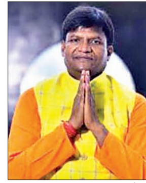
कल्याण राज्य मंत्री अनुप्रिया पटेल ने पत्र के माध्यम से सूचित किया कि यदि राज्य सरकार पीआईपी के तहत धनबाद में स्वास्थ्य सेवाओं को मजबूत करने के लिए एक

राज्य सरकार के धनबाद में स्वास्थ्य सेवाओं को मजबूत करने के लिए प्रस्ताव लाने का करेंगे समर्थन : अनुप्रिया पटेल आजाद सिपाही संवाददाता