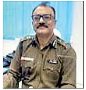
पुलिसकर्मियों को इसी भाव से अपनी ड्यूटी करनी चाहिए

रांची। राज्य के डीजीपी ने सभी जिलों के एसपी को पत्र लिख कर एफआइआर नहीं करनेवाले अधिकारियों पर कार्रवाई करने का निर्देश दिया है। पत्र लिख कर कहा है कि एफआइआर दर्ज नहीं करने वाले संबंधित थाना प्रभारियों पर अनुशासनिक कार्रवाई होगी। आम जनता से दुर्व्यवहार और बदतमीजी करनेवाले पुलिसकर्मियों के विरुद्ध भी कड़ी अनुशासनिक कार्रवाई की जायेगी। डीजीपी ने आदेशों में लिखा है कि विभिन्न सुदृष्ट से ऐसी जानकारियां प्राप्त हो रही हैं कि राज्य के अनेक जिलों में थाना प्रभारी एवं थाना के अन्य कर्मी विशेष कर मुंशी, आम जनता से अच्छा व्यवहार नहीं करते हैं। जनता की शिकायतों पर थाना में प्राप्ति रसीद भी नहीं देते हैं, जिसके चलते मुक्तभोगी भटकरते रहते हैं। उन्हें उचित न्याय नहीं मिल पाता है। डीजीपी ने पत्र में लिखा है कि सभी पुलिसकर्मियों को जानकारी दिये जाने की आवश्यकता है कि वे समाज और जनता के सेवक एवं सुरक्षाकर्मी हैं, ना कि उनके मालिक।