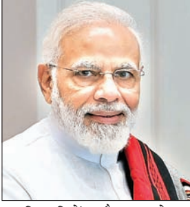
पदाधिकारियों और जमशेदपुर सांसद के अलावा कोल्हान के

रांची। प्रधानमंत्री नरेंद्र मोदी झारखंड दौरे पर आनेवाले हैं। वह 15 सितंबर को झारखंड के जमशेदपुर आनेवाले हैं। जमशेदपुर में वह दो वंदे भारत ट्रेन टाटा पटना और टाटा भुवनेश्वर को हरी झंडी दिखायेंगे। वहीं जमशेदपुर के गोपाल मैदान में जनसभा को भी संबोधित करेंगे। इस दौरान पीएम मोदी प्रदेश