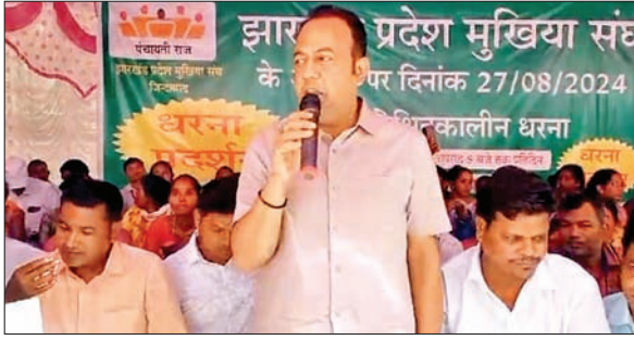
योजनाओं में पंचायत जनप्रतिनिधियों को शामिल करने की मांग शामिल है। धरना में

रांची। झारखंड प्रदेश मुखिया संघ के तत्वावधान में राजभवन के पास अनिश्चितकालीन धरना जारी है। मुखिया संघ के प्रतिनिधिमंडल ने मुख्यमंत्री से मुलाकात की और अपनी पांच सूत्री मांगों को रखा। मुखिया संघ की मांगों में राज्य वित्त आयोग की राशि शीघ्र पंचायतों को देने, जनप्रतिनिधियों को 30 लाख का मुआवजा देने, मानदेय 30,000 रुपये करने और सरकारी