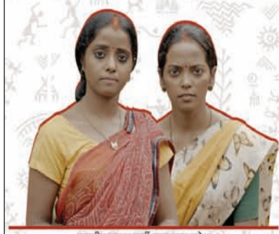
भारतीय जनता पार्टी, झारखण्ड प्रदेश