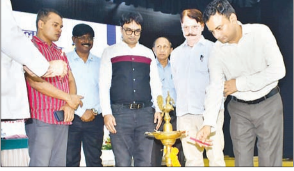
प्रशिक्षण कार्यक्रम का उद्घाटन करते डीसी सहित अन्य गणमान्य लोग।