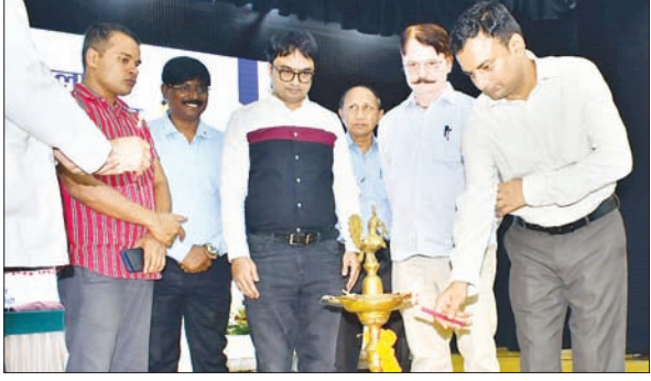
प्रशिक्षण कार्यक्रम का उद्घाटन करते डीसी सहित अन्य गणमान्य लोग।