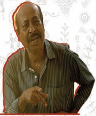
भारतीय जनता पार्टी, झारखण्ड प्रदेश