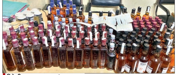
विदेशी शराब व झारखंड सरकार का नकली लोगो भी हुआ बरामद