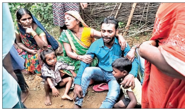
रोते बिलखते परिजन व समझाते लोग।