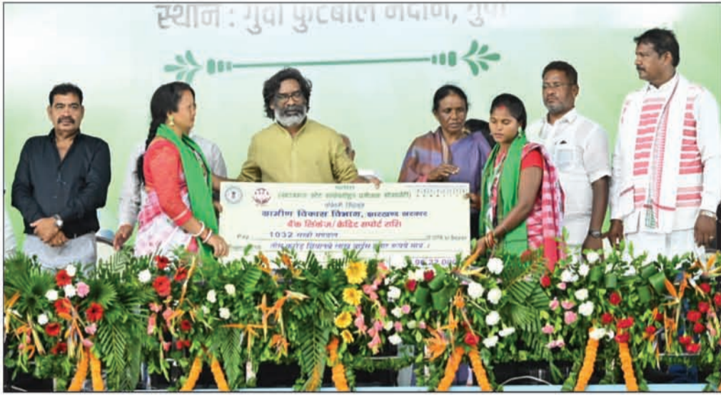
मुख्यमंत्री ने पश्चिमी सिंहभूम में कार्यक्रम के दौरान सरवी मंडल को 30 करोड़ रुपये से अधिक का बैंक क्रेडिट से जोड़ा

ग्रामीण महिलाएं और अर्थव्यवस्था सशक्त हो, इसके लिए राष्ट्रीय ग्रामीण आजीविका मिशन के जरिए राज्य के 26 लाख परिवारों को आजीविका के सशक्त माध्यमों से जोड़ा गया है। कृषि, पशुपालन, वनोपज, अंडा उत्पादन, जैविक खेती आधारित आजीविका से ग्रामीण परिवारों को आर्थादित किया जा रहा है। राज्य संपोषित जोहार परियोजना के तहत 17 जिलों के 68