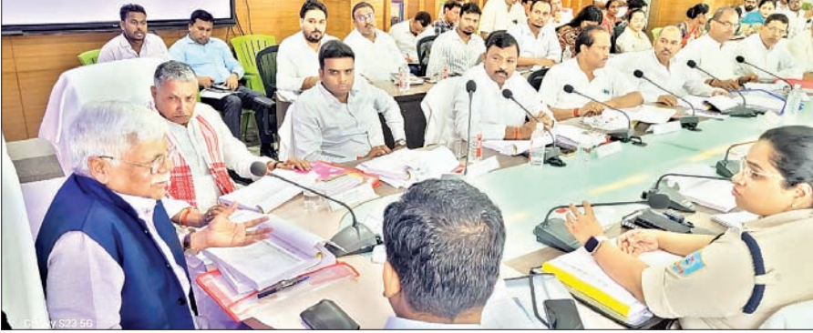
समाहरणालय सभागार में दिशा की बैठक में अधिकारियों को निर्देश देते सांसद वीडो राम व उपस्थित अन्य अधिकारीगण।

मेदिनीनगर। पलामू जिला विकास समन्वय एवं निगरानी समिति (दिशा) की बैठक सोमवार को समाहरणालय सभागार में हुई। जिसकी अध्यक्षता पलामू सांसद विष्णु दयाल राम ने की। इसमें जिले में आम लोगों के लिए चलायी जा रही योजनाओं की समीक्षा की गयी। साथ ही कुछ योजनाओं की धीमी प्रगति पर सांसद ने नाराजगी व्यक्त करते हुए संबंधित अधिकारी से सवाल-जवाब भी किया। लगे हाथ पिछली बैठक में लिए गये निर्णयों एवं अनुपालन विषय पर चर्चा भी की। बैठक में महात्मा गांधी राष्ट्रीय ग्रामीण रोजगार गारंटी योजना (मनरेगा), प्रधानमंत्री ग्राम सड़क योजना, सामाजिक सुरक्षा पेंशन, प्रधानमंत्री ग्रामीण आवास योजना, स्वच्छ भारत मिशन, राष्ट्रीय ग्रामीण पेयजल कार्यक्रम, प्रधानमंत्री कृषि सिंचाई योजना, राष्ट्रीय स्वास्थ्य मिशन, सर्व शिक्षा अभियान, समेकित बाल विकास योजना, प्रधानमंत्री उज्वला योजना, प्रधानमंत्री फसल बीमा योजना, बेटी बचाव बेटी पढ़ाओ, राष्ट्रीय खाद्य सुरक्षा का क्रियान्वयन, प्रधानमंत्री गरीब कल्याण योजना, प्रधानमंत्री