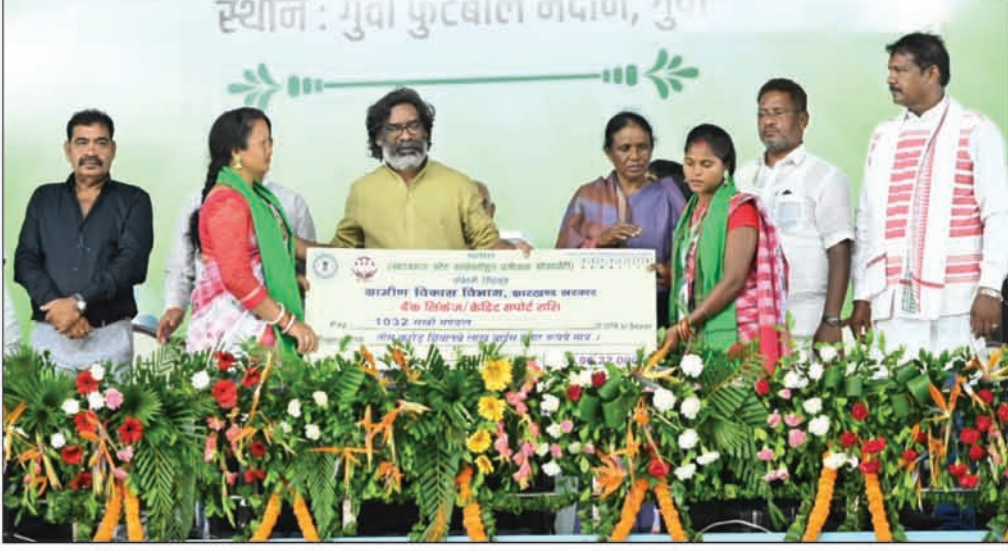
मुख्यमंत्री ने पश्चिमी सिंहभूम में कार्यक्रम के दौरान सरवी मंडल को 30 करोड़ रुपये से अधिक का बैंक क्रेडिट से जोड़ा

ग्रामीण महिलाएं और अर्थव्यवस्था सशक्त हो, इसके लिए राष्ट्रीय ग्रामीण आजीविका मिशन के जरिए राज्य के 26 लाख परिवारों को आजीविका के सशक्त माध्यमों से जोड़ा गया है। कृषि, पशुपालन, वनोपज, अंडा उत्पादन, जैविक खेती आधारित आजीविका से ग्रामीण परिवारों को आर्थादित किया जा रहा है। राज्य संपोषित जोहार परियोजना के तहत 17 जिलों के 68