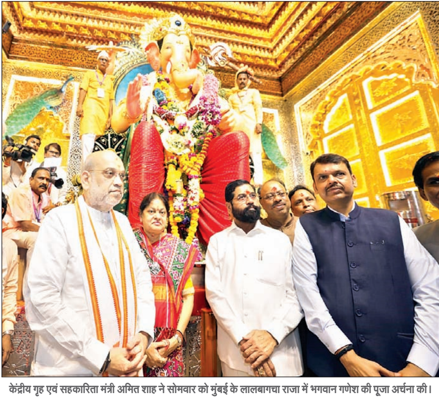
केन्द्रीय गृह एवं सहकारिता मंत्री अभित शाह ने सोमवार को मुंबई के लालबागवा राजा में भगवान गणेश की पूजा अर्चना की।

लिस्ट : 16 अगस्त को इलाहाबाद हाइकोर्ट ने 69,000 शिक्षकों की भर्ती की जून 2020 और जनवरी 2022 की मरिट लिस्ट रद्द कर दी थी। बेंच ने सरकार को सहायक शिक्षक भर्ती परीक्षा का रिजल्ट नए सिरे से जारी करने का भी आदेश दिया था। बेसिक शिक्षा विभाग को 3 महीने में नयी चयन सूची जारी करनी थी। कोर्ट में शिक्षकों की भर्ती में 19 हजार सीटों पर आरक्षण घोटाला सामने आया था। ऐसे में बेंच ने आदेश दिया कि आरक्षण नियमावली 1981 और आरक्षण नियमावली 1994 का पालन करके नई लिस्ट बनाई जाए। इससे पहले लखनऊ हाइकोर्ट की सिंगल बेंच भी ये मान चुकी थी कि 69,000 शिक्षकों की भर्ती में 19,000 सीटों पर आरक्षण का घोटाला हुआ था।