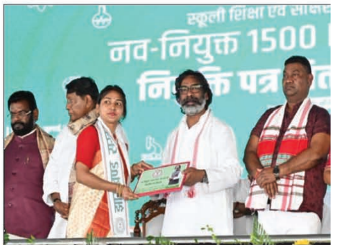
मुख्यमंत्री ने 1500 स्नातकोत्तर प्रशिक्षित अभ्यर्थियों को नियुक्ति पत्र सौंपा।

झारखण्ड को बने दो दशक से अधिक हो गए। लेकिन, विभिन्न विभागों में जहां कई पदों पर पहली बार नियुक्ति हुई तो कहीं नियुक्ति नियमावली भी पहली बार बनायी गयी। सभी अड़कों को दूर कर झारखण्ड सरकार क्रमबद्ध और योजनाबद्ध तरीके से पूरी तेजी के साथ खाली पदों को भरने का अभियान शुरू कर चुकी है और यह सिलसिला लगातार जारी है।