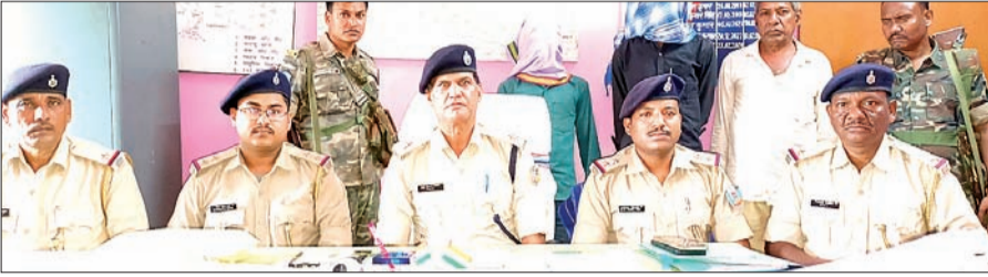
हत्या के आरोप में पकड़े गये आरोपितों की जानकारी देती मनातू पुलिस।