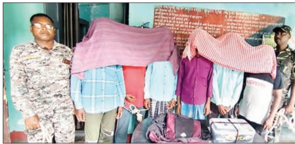
मोबाइल चोरों को जेल ले जाने की तैयारी करती बरमो पुलिस।