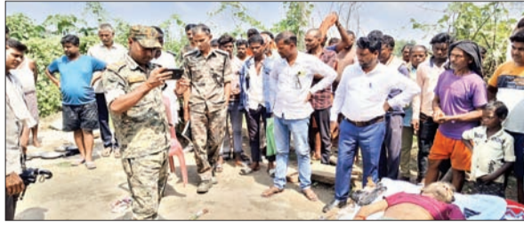
मृतक के शव का पंचनामा करते थाना प्रभारी व मौके पर मौजूद लोग।