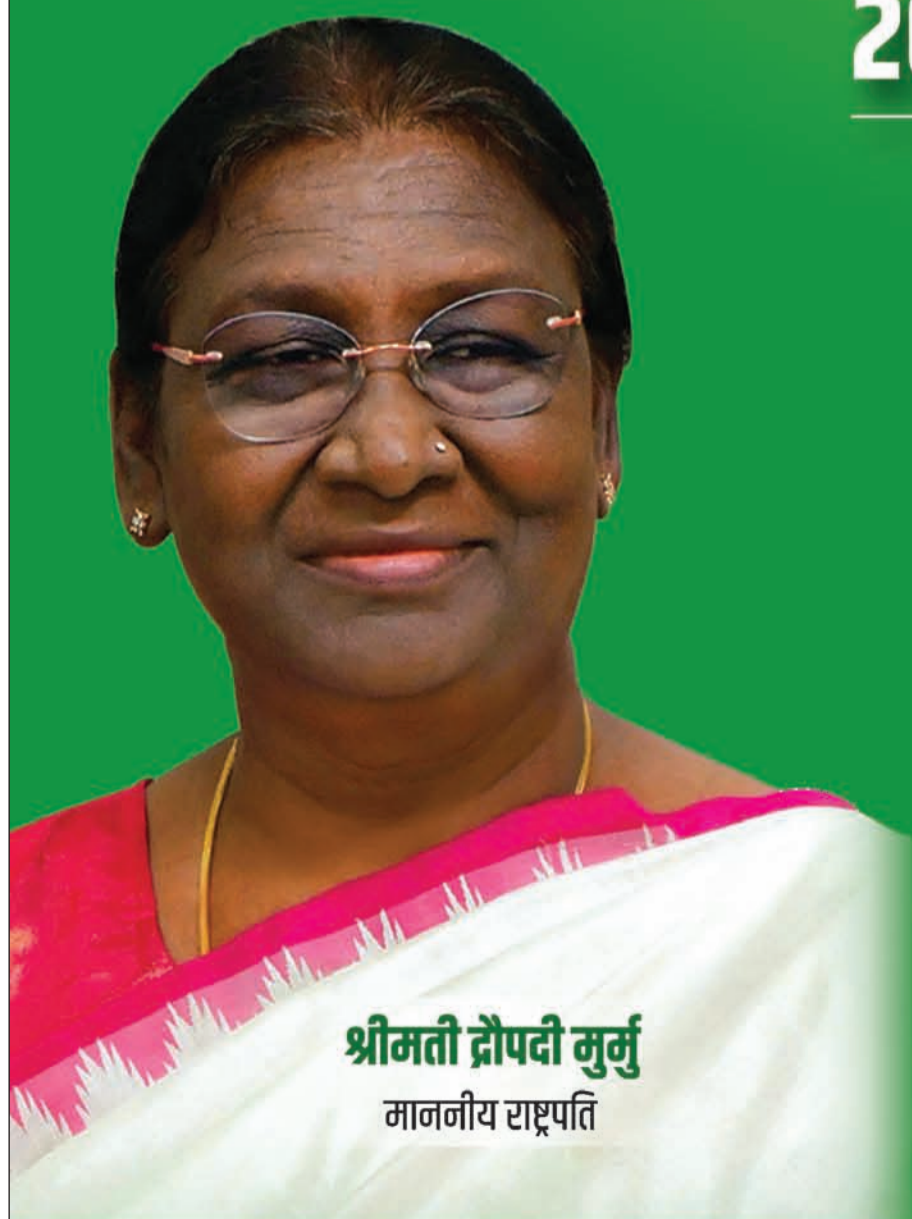
श्रीमती द्रौपदी मुर्मु माननीय राष्ट्रपति