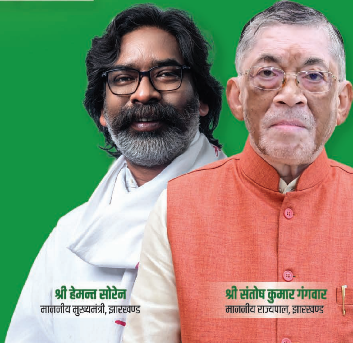
श्री हेमन्त सोरेन माननीय मुख्यमंत्री, झारखण्ड