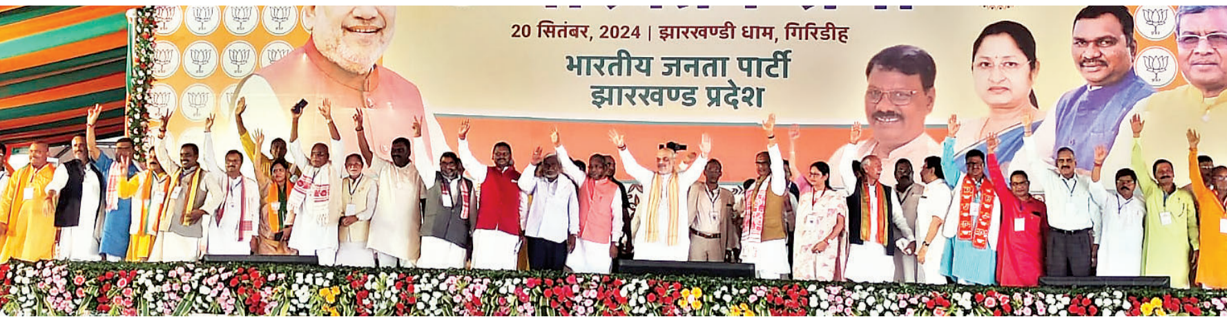
20 सितंबर, 2024 | झारखण्ड की धाम, गिरिडीह