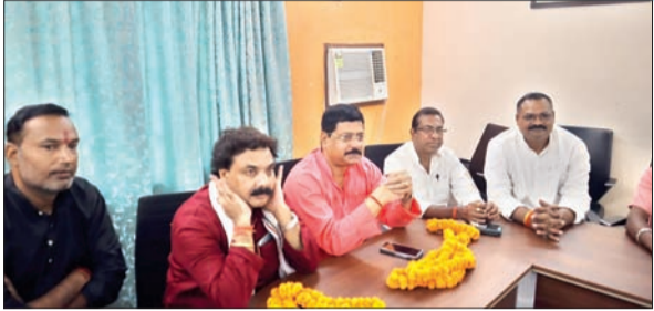
धनबाद विस के उम्मीदवारों के चयन को लेकर हुई कांग्रेस की बैठक में उपस्थित नेतागण।