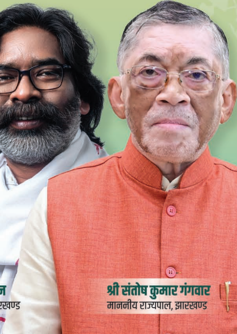
श्री संतोष कुमार गंगवार माननीय राज्यपाल, झारखण्ड