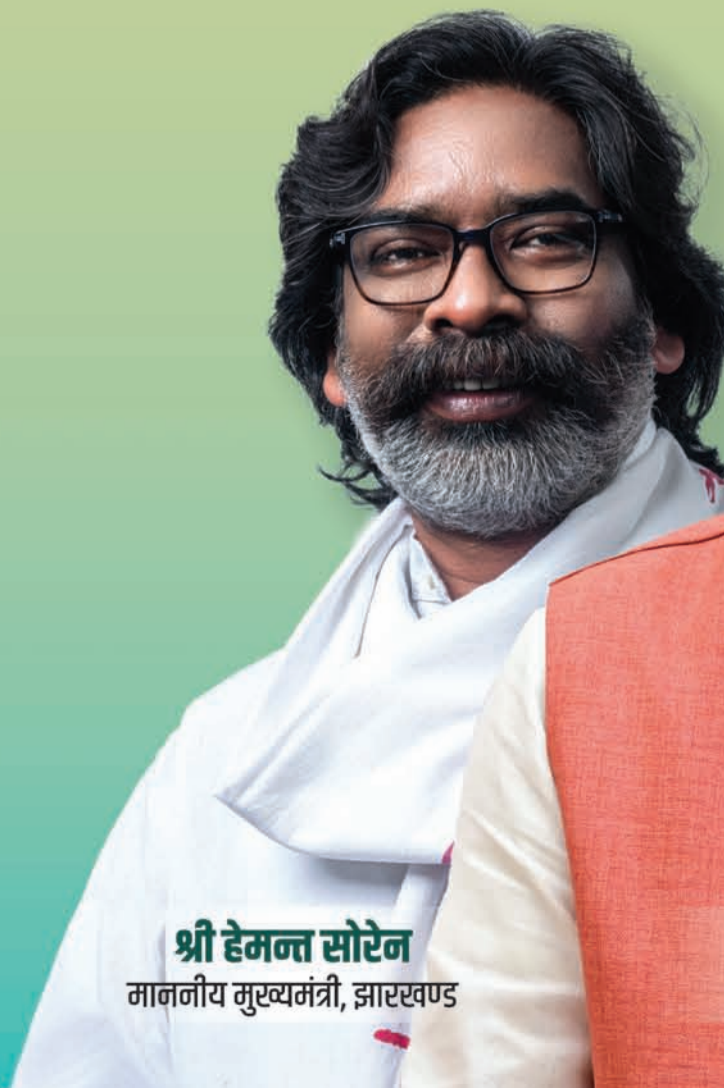
श्री हेमन्त सोरेन माननीय मुख्यमंत्री, झारखण्ड