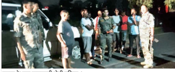
घटना के बाद जानकारी लेती पुलिस।