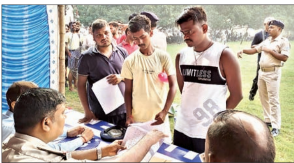
शारीरिक दक्षता जांच परीक्षा के दौरान अभ्यर्थियों के कागजातों की जांच करते अधिकारी।

बोकारो। जिले में चौकीदार संवर्ग के कुल 159 पदों पर सीधी नियुक्ति के लिए सेक्टर 12 स्थित जैप-4 मैदान में शनिवार को आयोजित शारीरिक दक्षता जांच परीक्षा शांतिपूर्ण माहौल में संपन्न हुआ। सुबह से ही अभ्यर्थियों का जुटान होने लगा था। क्रमवार अभ्यर्थियों की उपस्थिति दर्ज करते हुए मैदान में प्रवेश कराया गया। प्रतिनियुक्त टीम द्वारा ऊंचाई एवं दौड़ जांच किया गया। बताते चलें कि लिखित परीक्षा में उत्तीर्ण 564 अभ्यर्थियों को शारीरिक दक्षता जांच परीक्षा के लिए आमंत्रित किया गया था, जिसमें 536