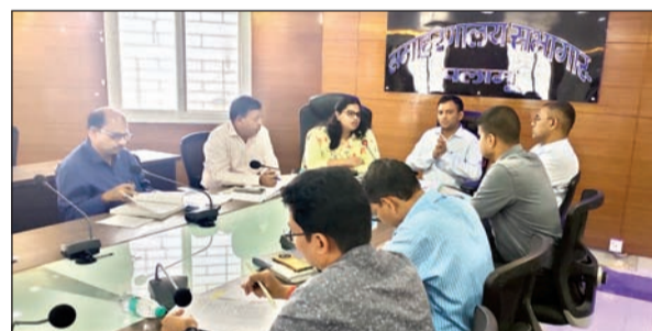
आजाद सिपाही संवाददाता

मेदिनीनगर। जिला निर्वाचन पदाधिकारी सह डीसी शशि रंजन की अध्यक्षता में शनिवार को समाहरणालय के सभागार में आयकर, उत्पाद, परिवहन, जीएसटी, बैंक, नारकोटिक्स आदि समेत विभिन्न परिवर्तन एजेसियों के पदाधिकारियों संग बैठक आयोजित की गयी। बैठक में आगामी विधानसभा चुनाव 2024 को शांतिपूर्ण और निष्पक्ष तरीके से संपन्न कराने की कार्ययोजना तैयार की गयी। उन्होंने सभी संबंधितों को चुनाव के दौरान धन का अवैध इस्तेमाल रोकने से संबंधित निर्देशित किया इस हेतु अलर्ट मोड में रहने पर बल दिया। जिले में अवैध शराब का कारोबार शून्य करने को लेकर उत्पाद अधीक्षक और परिवहन पदाधिकारी को आपस में बेहतर संवयव स्थापित करते