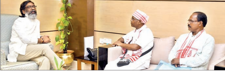
मुख्यमंत्री हेमंत सोरेन को आमंत्रण पत्र देने पहुंचे ऐतिहासिक राजी पड़हा जतरा समिति मुड़मा का प्रतिनिधिमंडल।

मांडर। प्रखंड स्थित मुड़मा में 18-19 अक्टूबर को लगने वाले जतरा को लेकर सोमवार को ऐतिहासिक राजी पड़हा मुड़मा जतरा संचालन समिति की बैठक हुई। इसकी अध्यक्षता बोडीओ ने की। बैठक में जतरा की तैयारियों से संबंधित विभिन्न पहलुओं पर चर्चा की गयी। इस दौरान बैठक में विद्युत विभाग, पेय जल एवं स्वच्छता विभाग, खाद्य आपूर्ति विभाग, मनरेगा, स्वास्थ्य विभाग समेत अन्य विभागों के प्रतिनिधि उपस्थित हुए। इसमें जनता सुविधा का ख्याल रखते हुए हर विभाग को निर्देश दिया गया कि मेला में आगंतुक को किसी भी तरह की