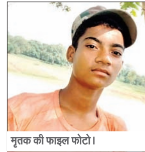
मृतक की फाइल फोटो।

सोनाहात/बुंदू। थाना क्षेत्र के सोनाहात-सिल्ली सड़क के बलुवाडीह मोड़ के समीप दो बाइक में सीधी टक्कर से बाइक सवार पांच लोग गंभीर रूप से घायल हुए हैं। इसमें एक की मौत हो गयी। घटना रविवार देर शाम बतायी जा रही है। घटना के संबंध में बताया गया है कि टीवीएस अपाची जेएच01इएन 6283 और होंडा साइन जेएच01एटी 7604 में सीधी टक्कर हो गयी। टक्कर के बाद दोनों बाइक में सवार सभी एक महिला सहित चार लोग गंभीर रूप से घायल हुए। पुलिस के मदद से लोगों ने पांचों को सोनाहात अस्पताल पहुंचाया।