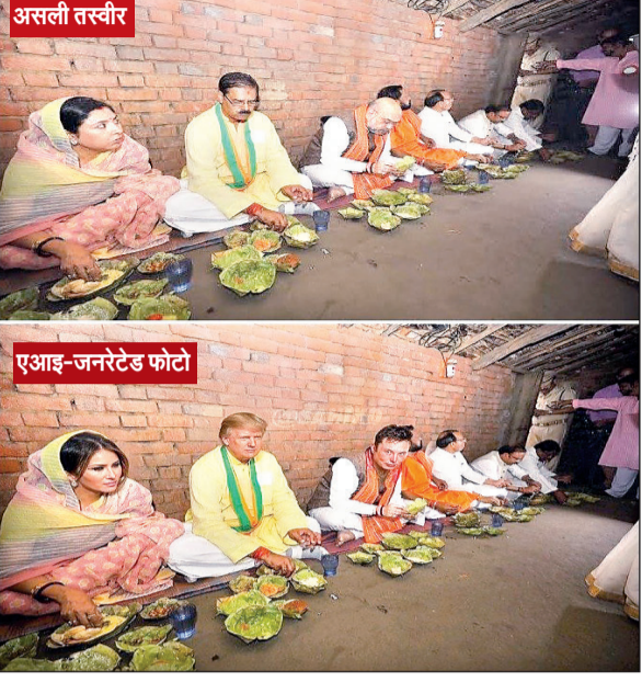
असली तस्वीर एआई-जनरेटेड फोटो

आजाद सिपाही संवाददाता भुवनेश्वर। पूरी दुनिया का ध्यान 2024 के अमेरिकी चुनावों पर है, वहीं राष्ट्रपति पद के उम्मीदवार डोनाल्ड ट्रंप और कमला हैरिस मतदाताओं को लुभाने में कोई कसर नहीं छोड़ रहे हैं, क्योंकि कुछ ही घंटों बाद मतदान होना है। समय के संकेत को समझते हुए, डोनाल्ड ट्रंप की टीम भी एआई (कृत्रिम बुद्धिमत्ता) अभियान चला रही है और मतदाताओं का दिल जीतने के लिए भारतीय राजनेताओं सहित विभिन्न व्यक्तियों की एआई-जनरेटेड छवियों का उपयोग कर रही है। डोनाल्ड ट्रंप की टीम ने अब एआई द्वारा तैयार की गयी तस्वीर