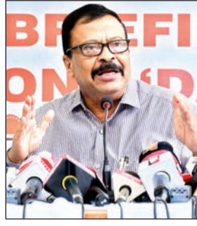
विभागों की रिपोर्ट आ गयी है। शाम तक सभी रिपोर्ट प्राप्त होने के बाद अंतिम गणना की जायेगी।