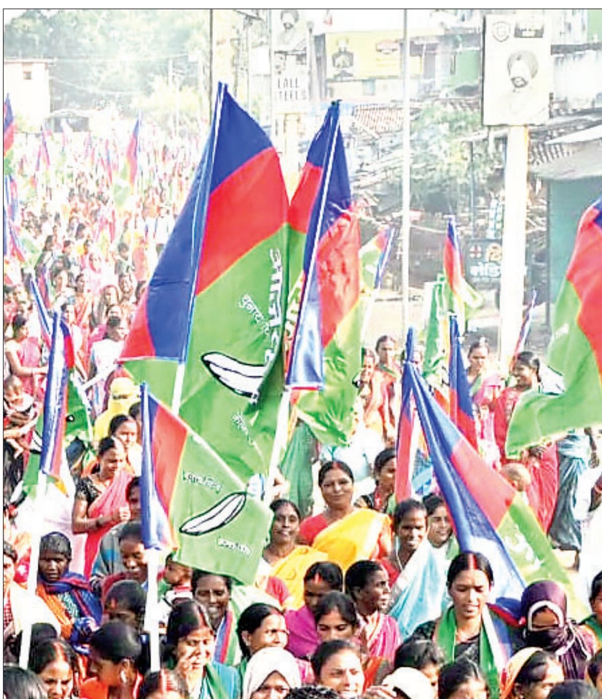
उससे लगातार बिदकने लगे थे।

यहां एक और बात ध्यान देने वाली है। सुदेश महतो के ससुर उमेशचंद्र मेहता ने आजसू के टिकट पर 2014 में गिरिडीह से लोकसभा चुनाव लड़ा था। इन्हें 55 हजार 531 वोट आये थे। वहीं टाड़गर जगरनाथ महतो को तीन लाख 51 हजार 600 वोट आये थे और वह 40 हजार 313 वोटों से हार गये थे। कुर्मी समाज में यह मैसेज गया कि टाड़गर जगरनाथ महतो की हार आजसू प्रत्याशी उमेशचंद्र मेहता के कारण हुई है। इसका मैसेज भी आजसू के प्रति कुर्मी समाज में अच्छा नहीं गया। गांव वाले कहने लगे ये लोग कुर्मी विरोधी हैं। अब आजसू की कुर्मी मतदाताओं में पकड़ ढीली होनी शुरू हो चुकी थी। कुर्मी मतदाता