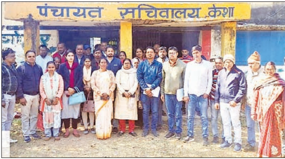
बारीकियों को बताया और पारदर्शिता से संबंधित कई हिदायत दी। उन्होंने सभी पंचायत में सेवन रजिस्टर पूर्ण रूप से संधारित करने का निर्देश दिया। साथ ही मनरेगा

बेड़ो। मनरेगा लोकपाल पुष्पलता जायसवाल ने शनिवार को बेड़ो प्रखंड के केशा पंचायत का भ्रमण किया। इस दौरान उन्होंने योजनाओं का निरीक्षण किया। साथ ही पंचायत सचिवालय में सेवन रजिस्टर और योजनाओं से संबंधित अभिलेख का निरीक्षण करते हुए सभी प्रकार की कमियों को दुरुस्त करने का निर्देश दिया। लगे हाथ केशा पंचायत सचिवालय में मनरेगा कर्मियों और पंचायत सचिवों के साथ बैठक की। इस दौरान उन्होंने मनरेगा की