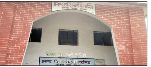
आजाद सिपाही संवाददाता

हुसैनाबाद। झारनेट सर्वर डाउन होने से हुसैनाबाद अंचल कार्यालय में दखिल खारिज संबंधित करीब 597 मामले लॉकवेट हैं। अभी म्यूटेशन व अन्य जमीन सम्बंधित सभी कार्य नहीं हो पा रहा है। इससे रैयतों को काफी परेशानी हो रही है। इस मामले में राजस्व कर्मी भी कुछ जबाब देने की स्थिति में नहीं है। हालांकि उन्होंने पूरे मामले से राजस्व, निबंधन एवं भूमि सुधार विभाग को अवगत करा दिया है। विदित हो कि आचार संहिता लगने के पहले 29 सितंबर से पूरे राज्य में झारनेट का सर्वर बैठ गया था। चुनाव परिणाम आने के बाद सर्वर तो ठीक हुआ, पर सर्वर डाउन