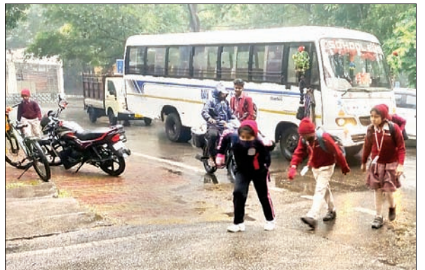
कोहरे की चपेट में रहा। इस कारण ठंड अचानक बढ़ गयी। लोग अचानक बदलते ठंड से बचते देखे गये। इधर, बारिश के कारण कोयलांचल क्षेत्र के सभी सड़कों की सूरत बिगड़ गयी है। ट्रंसपोर्टिंग सड़कों पर कीचड़ों का अंधार लगने से आवागमन करने वाले लोगों को काफी परेशानियों का सामना करना पड़ रहा है।

पिपरवार। सीसीएल पिपरवार कोयलांचल क्षेत्र व आसपास के ग्रामीण इलाकों में सोमवार की सुबह से हुई बारिश के कारण मौसम का मिजाज अचानक बदल गया। जानकारी के अनुसार इस दिन कोयलांचल में सुबह की शुरुआत घने कोहरे के साथ हुई। देखते ही देखते अचानक झमाझम बारिश होने लगी। इस कारण पूरे इलाके में सन्नाटा पसर गया। सुबह बारिश होने के कारण कई बच्चे भींग कर स्कूल जाते दिखे। करीब एक घंटे तक पूरे इलाके में झमाझम बारिश होने के बाद दिनभर पूरा इलाका बादलों और