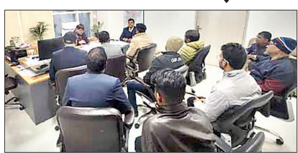
लाउडस्पीकर एवं बैंड का उपयोग के संबंध में लागू प्रिविलेज अधिनियम के आलोक में लाउडस्पीकर और बैंड का

रांची। रांची नगर निगम क्षेत्रांतर्गत स्थित बैंकवेट हॉल/विवाह भवन से विवाह एवं अन्य समारोह में ध्वनि विस्तारक यंत्र का उपयोग रात में किये जाने पर आमजनों को होने वाली परेशानियों को देखते हुए इसके संचालकों की एक बैठक सोमवार को आहूत की गयी। इसमें सभी को स्पष्ट निर्देश दिया गया कि राज्य में