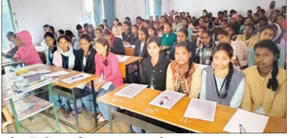
परीक्षा हॉल में उत्तर पुस्तिका का इंतजार करती छात्राएं।

बेड़ो। प्रखंड मुख्यालय स्थित एएसएस प्लस टू उच्च विद्यालय में सोमवार को प्री बोर्ड परीक्षा का पहला दिन अत्यवस्था की भेंट चढ़ गया। घंटों इंतजार करने के बाद छात्रों को प्रश्न पत्र तो मिला, लेकिन उत्तर लिखने के लिए पेपर नहीं मिला। स्कूल में मौजूद प्रश्न-पत्रों के चलते शिक्षक एवं बच्चों को काफी कठिनाईयों का सामना करना पड़ा। जबकि पूर्व घोषित परीक्षा कार्यक्रम के कारण छात्र निर्धारित समय पर तैयारी कर पहुंच गए थे। परीक्षा शुरू होने का समय 9.45 बजे से निर्धारित था। शिक्षकों ने व्यवस्थित ढंग से परीक्षार्थियों को बैठाया। जहां प्लस टू स्कूल में शुरू हुई प्री बोर्ड परीक्षा के प्रथम पाली में 12वीं के विज्ञान संकाय ने भौतिक, वाणिज्य