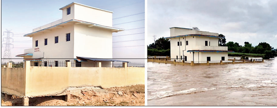
बतरे नदी में पानी से घिरा उप स्वास्थ्य केंद्र का निर्मित भवन।

हरिहरगंज/ पलामू (आजाद सिपाही)। जिले के हरिहरगंज अंचल क्षेत्र के कुलहिया पंचायत अंतर्गत जहाना में बतरे नदी के बिचोबीच उप स्वास्थ्य केंद्र भवन निर्माण करने का मामला उजागर हुआ है। सड़क से करीब पांच सौ मीटर दूरी पर बतरे नदी में लाखों रुपए की लागत से उप स्वास्थ्य केंद्र का निर्माण कराया गया है। नदी में उप स्वास्थ्य केंद्र बनाया जाना सरकारी रुपयों का दुर्योग है। जहां रोगियों और स्वास्थ्य कर्मियों को जाने के लिए सड़क की व्यवस्था तक नहीं है। इसमें राजस्व और भवन निर्माण विभाग की लापरवाही बतायी जा रही है। राजस्व और भवन निर्माण विभाग के कुछ अधिकारियों की कमीशनखोरी के चलते नदी में ही भवन निर्माण की बात कही जा रही है। राजस्व विभाग के द्वारा भूमि चर्चनित कर भवन निर्माण विभाग को मुहैया कराया गया है।