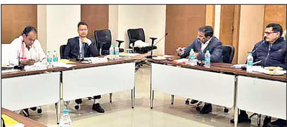
लगभग 5.5 लाख उपभोक्ताओं को राशन कार्ड से जोड़ने का कार्य प्राथमिकता के आधार पर किया जायेगा। कोई भी परिवार अनाज के अभाव में भूखा न रहे, यह तब हो। मुख्यमंत्री हेमंत सोरेन की पहल के तहत सोहराय पर्व के अवसर पर बेहतर गुणवत्ता की धोती, लूंगी और साड़ी का वितरण किया जायेगा। इस योजना में पूर्व में हुई

रांची। खाद्य, सार्वजनिक वितरण एवं उपभोक्ता मामले विभाग की बैठक मंत्री डॉ इरफान अंसारी की अध्यक्षता में प्रोजेक्ट बिल्डिंग के एनेक्सी भवन में बुधवार को आयोजित की गयी इसमें विभाग के सभी वरिष्ठ अधिकारी और अन्य पदाधिकारी भी उपस्थित रहे। मंत्री ने बैठक में विभागीय कार्यों की गहराई से समीक्षा की। कहा कि यह विभाग हरीब और मध्यम वर्ग के लोगों से सीधा जुड़ा है। इसलिए किसी भी प्रकार की लापरवाही या गड़बड़ी बर्दाश्त नहीं की जायेगी। साथ ही उन्होंने कई घोषणाएं की और निर्देश विभागीय पदाधिकारियों को दिये। कहा कि राज्य के