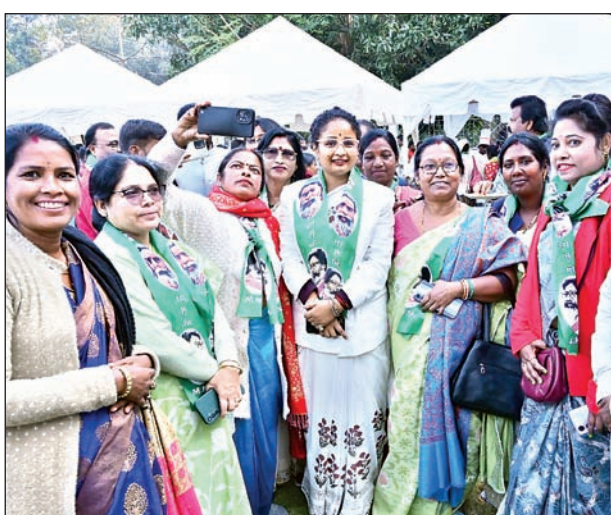
परिवार की जड़ों को राज्य के प्रत्येक कोने में पहुंच मजबूत करने का काम करना है, वंचित, शोषित समेत समाज के सभी वर्गों को हक-अधिकार देने का काम करना है।