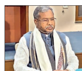
अमल न होने से किसान खुद को टगा हुआ महसूस कर रहे हैं। बाबूलाल ने बुधवार को सोशल मीडिया एक्स पर ट्वीट

रांची। भारतीय जनता पार्टी के प्रदेश अध्यक्ष बाबूलाल मरांडी ने कहा है कि झामुमो-कांग्रेस गठबंधन ने किसानों से वादा किया था कि धान की खरीद 3200 रुपये प्रति क्विंटल की दर से की जायेगी लेकिन चुनावी वादों पर