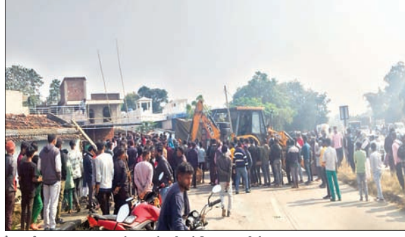
और दुर्घटनाग्रस्त वाहन को उठाने की कोशिश करती क्रेन।