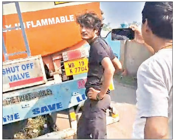
नाले में फंसे तेल टैंकर को निकालने का प्रयास करता चालक।

आजाद सिपाही संवाददाता झरिया। बस्ताकोला राजापुर में संचालित देवप्रभा आउटसोर्सिंग कंपनी के लिए 40 हजार लीटर तेल लेकर जा रहा एक टैंकर बस्ताकोला के घनी आबादी वाले क्षेत्र में सड़क किनारे एक नाले में गिर गया। जिससे एक बड़ा हादसा टल गया। बताया जा रहा कि बनारस से 40 हजार लीटर तेल लेकर चला हिंदुस्तान पेट्रोलियम का टैंकर देवप्रभा आउटसोर्सिंग कंपनी में जा रहा था। लेकिन तंगी गली होने के कारण चालक वाहन से नियंत्रण खो दिया और टैंकर के बाएँ साइड का चक्का सड़क किनारे नाली में जा गिरा। वहां सड़क के दोनों किनारे कई घर हैं, और यह एक घनी आबादी वाला क्षेत्र है। उधर, घटना की सूचना