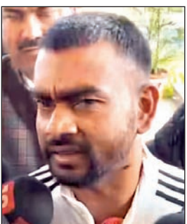
कीजिए। लाठीचार्ज के सवाल पर उन्होंने कहा कि कई छात्र के अलावे हमारे पार्टी के प्रत्याशी भी घायल हैं। उनसे मेरी मुलाकात नहीं हुई है। कल तक सदन है, सदन खत्म होने के बाद ही हम उनसे मिलेंगे। इस मुद्दे को भी मैं सदन में उठाऊंगा अगर मुझे समय मिला तो। उनसे जब एक पत्रकार ने पूछा कि