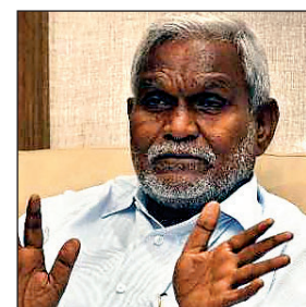
पांव पालने में ही दिख जाते हैं। सरकार ने अपने पहले ही

सरायकेला। झारखंड के पूर्व मुख्यमंत्री और सरायकेला से बीजेपी विधायक चंपाई सोरेन ने जेएसएससी सीजीएल के छात्रों पर हुए लाठी चार्ज के मामले में सरकार को घेरा है। उन्होंने कहा है कि भाजपा आंदोलन कर रहे छात्रों के साथ खड़ी है। उन्होंने अपने सोशल मीडिया हैंडल एक्स पर ट्वीट करते हुए लिखा कि पूत के