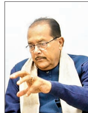
सिर्फ टैबलेट से आप किसी कुपोषित बच्चे की समस्या का हल नहीं ढूँढ सकते हैं। किसी बीमारी का इलाज नहीं ढूँढ सकते हैं। उसको प्रॉपर डायट भी मिलनी चाहिए।

एग्रीकल्चर, एलाइड एग्री सेक्टर को मजबूत करने की जरूरत