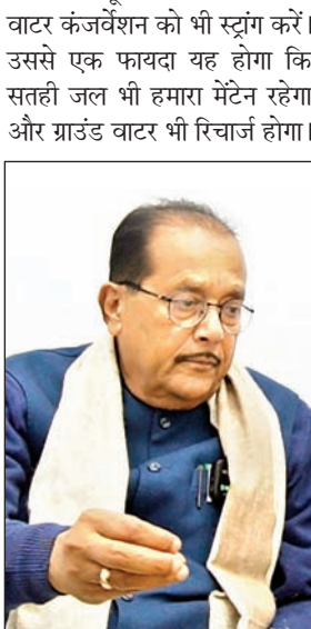
हमारे पास माइंस-मिनरल्स हैं, कच्चा माल है, तो उस पर आधारित उद्योग यदि यहाँ लगाया जाये, तो राजस्व भी मिलेगा और रोजगार के अवसरों का भी सृजन होगा, जो हमारे लिए जरूरी है।

बड़ी समस्या रही है, दुर्भाग्यवश पूर्ववर्ती जो सरकार रही, हेमंत सोरेन के पहले, वाटर कंजर्वेशन पर उन्होंने कोई ध्यान नहीं दिया। आप देखेंगे कि हमारे यहाँ जो नॉर्मल आवश्यकता है, सामान्य वर्षापात का, वह 1200 से 1300 मिलीमीटर प्रति वर्ष है। लेकिन जब कभी सुखाड़ का सामना इस राज्य ने किया है, तो 600-700 मिमी बारिश हुई है। दुर्भाग्यपूर्ण यह रहा कि 600-700 मिमी बारिश में 20 प्रतिशत ही वर्षा जल को हम बचा पाते हैं, शेष 80 प्रतिशत वर्षा जल नदी नालों के माध्यम से समुद्र में चला जाता है। आवश्यकता इस बात की है कि यह जो वर्षा जल है, इस जल को कैसे संचय करें, संग्रहीत करें, इसकी आवश्यकता है। हेमंत सोरेन का पूरा फोकस है कि हम वाटर कंजर्वेशन को भी स्ट्रॉंग करें। उससे एक फायदा यह होगा कि सही जल भी हमारा मॅटेन रहेगा और ग्राउंड वाटर भी रिचार्ज होगा।