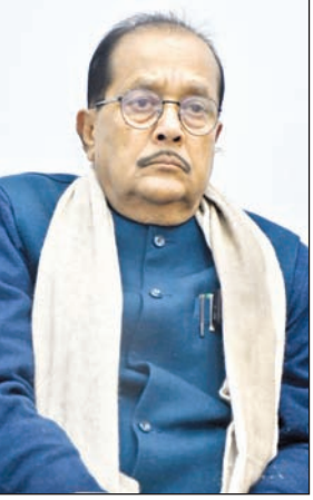
यह हेमंत सोरेन की सरकार ही है जिसने, ग्रामीण अर्थव्यवस्था और ग्रामीण क्षेत्र में रहने वाले लोगों की आर्थिक संपन्नता की परिकल्पना की है।