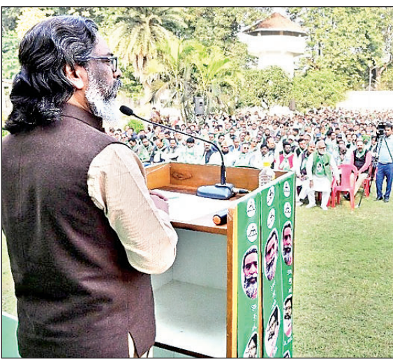
और करोड़ों राज्यवासियों के आशीर्वाद के फलस्वरूप झारखंड में मजबूत अबुआ सरकार का गठन हुआ। आप सभी को इसके लिए हार्दिक बधाई और जोहार। आने वाले समय में हमें झामुमो

राज्यवासियों के आशीर्वाद से मजबूत अबुआ सरकार का गठन हुआ : सीएम ने कहा कि विगत विधानसभा चुनाव में आप सभी कर्मठ नेताओं और जुझारू कार्यकर्ताओं की कड़ी मेहनत