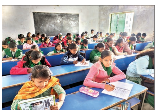
लापुंग के एक विद्यालय में परीक्षा देते छात्र-छात्राएं।

लापुंग। प्रखंड के सभी आठ संकुल अंतर्गत विद्यालयों में पहली से सातवीं कक्षा तक की एसए वन की परीक्षा सोमवार से शुरू हुई। पहले दिन प्रथम पाली में अंग्रेजी की परीक्षा हुई। जबकि द्वितीय पाली में छठी एवं सातवीं कक्षा में सामाजिक विज्ञान की परीक्षा हुई। पहली बार विभाग की ओर से एसए वन की परीक्षा में प्रश्न पत्र की हार्ड कॉपी उपलब्ध नहीं कराया गया। विभागीय निदेशानुसार शिक्षक-शिक्षिकाओं ने गुरु जी एप से प्रश्नपत्र डाउनलोड कर उसे जेरॉक्स करा कर छात्र-छात्राओं के बीच वितरित किया गया। कहीं-कहीं तो