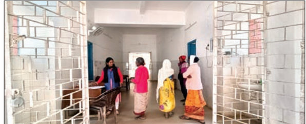
इटकी आरोग्यशाला के इंस इस्टर वार्ड में भर्ती 42 मरीजों का चल रहा इलाज।

इटकी। यक्ष्मा आरोग्यशाला में भर्ती मरीजों की चिकित्सा सेवा मात्र एक नर्स के भरोसे चल रही है। कभी एशिया महाद्वीप में इटकी यक्ष्मा आरोग्यशाला चिकित्सा को लेकर अपना परचम लहराने वाला अस्पताल था, जिसकी दुर्गति हो गई है। पिछले 11 महीने में यहां इलाज रत टीबी के 20 मरीजों की मौत हो चुकी है। नर्सों के अभाव में मरीजों के उपचार का कार्य बुरी तरह प्रभावित है। आरोग्यशाला में परिचारिका ए श्रेणी के 38 पद है जिसमें फिलहाल केवल एक नर्स और एक मेट्रोन कार्यरत है। 36 पद रिक्त है। वहीं, परिचारिका बहन के लिए सातों पद रिक्त है। मेट्रोन प्रशासनिक कार्य में व्यस्त रहती है, जबकि एक नर्स भर्ती मरीजों के उपचार का भार संभाल रखी है। यहां नर्सों के भारी अभाव के कारण मरीजों को समय से दवा, इंजेक्सन सहित अन्य उपचार