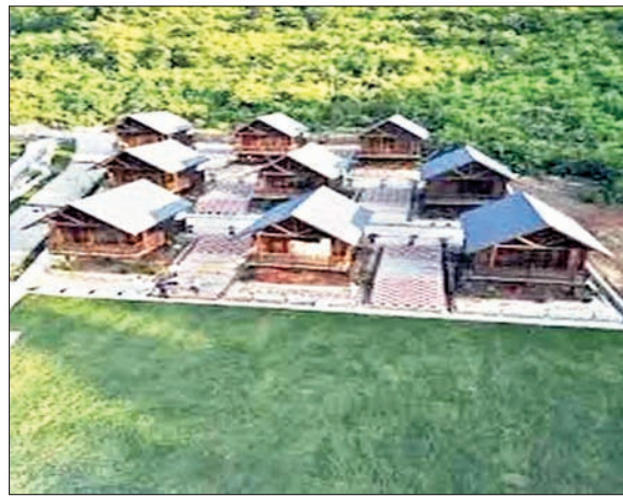
11 इको काँटेज का किया गया है निर्माण खूबसूरत इंटीरियर डिजाइनिंग के साथ एसी भी लगा है।