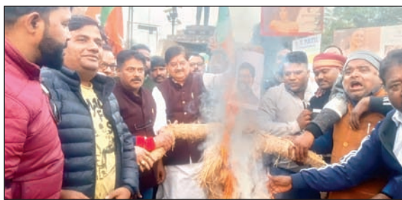
विधायक ने की सीबीआइ से सीजीएल परीक्षा की जांच कराये की मांग