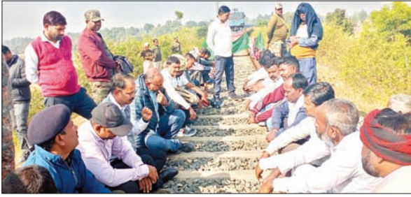
नौकरी-मुआवजा की मांग पर मैकलुस्कीगंज-पिपरवार रेल लाइन फेज वन को अवरुद्ध कर प्रदर्शन करते रैयत-ग्रामीण।

खलारी। रैयत विस्थापित मोर्चा के बैनर तले नौकरी और मुआवजे की मांग को लेकर शुक्रवार को मैकलुस्कीगंज-पिपरवार रेल लाइन फेज वन को ग्रामीणों ने बंद करा दिया। मोर्चा और ग्रामीण झंडा-बैनर लेकर रेलवे ट्रैक पर ही धरने पर बैठ गए। जिस कारण उक्त रेल लाइन पर कोयला ढुलाई पूरी तरह बंद रही। इस दिन सुबह 10 बजे पिपरवार राजघर साईडिंग से एक मालगाड़ी कोयला लेकर रेलवे ट्रैक पर आयी जो हेसालोंग गंडु टोला में आंदोलनरत ग्रामीणों ने उतरे रोक दिया। इसकी जानकारी मिलने पर अशोक परियोजना