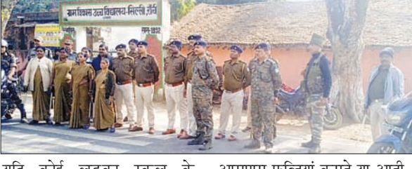
यदि कोई लड़का स्कूल के आसपास फर्नियां कसते या आती-

सिल्ली पुलिस की ओर से शुक्रवार को महिला बाल सुरक्षा, छेड़खानी एवं सड़क सुरक्षा को लेकर जागरूकता अभियान चलाया गया। इस दौरान सिल्ली बाजार से आजाद स्कूल तक पुलिस ने पैदल मार्च किया गया। पुलिस ने हिदायत दी है कि